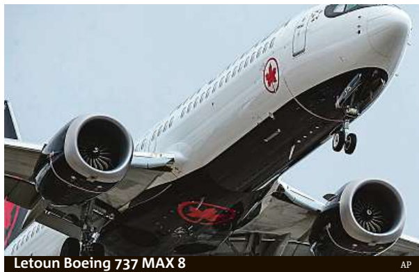
Letoun Boeing 737 MAX 8

Výkonný ředitel společnosti Tewolde GebreMariam uvedl, že kvůli blízkosti a rychlosti mohou být černé skříňky poslány do některé z evropských zemí spíše než do USA,