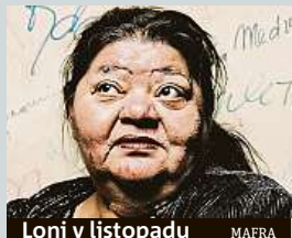
Loni v listopadu