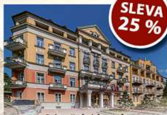
Lázeňský hotel **** PAWLIK - AQUAFORUM