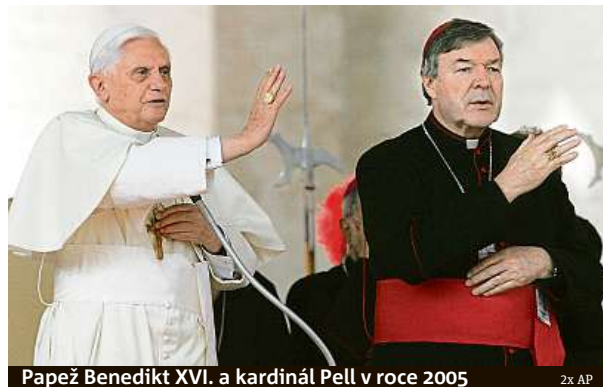
Papež Benedikt XVI. a kardinál Pell v roce 2005