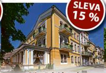
Lázeňský hotel *** BELVEDERE