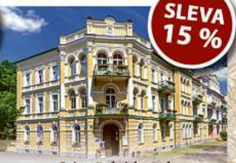
Lázeňský hotel *** METROPOL