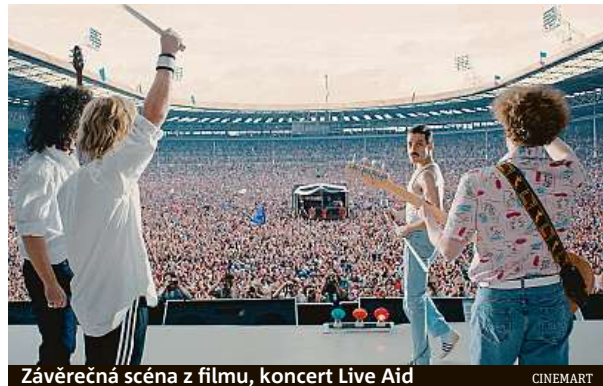
Závěrečná scéna z filmu, koncert Live Aid

Bohemian Rhapsody se nejspíš stane nejprodávanějším diskem posledních let.