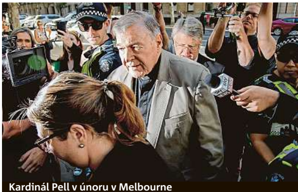
Kardinál Pell v únoru v Melbourne