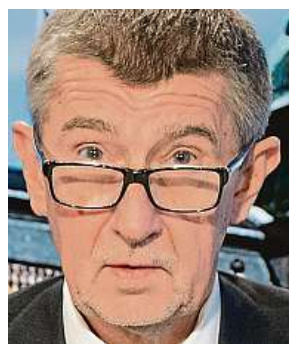
Andrej Babiš

Český premiér Andrej Babiš si telefonoval s britskou premiérkou Theresou Mayovou. „Říkal jsem jí, že nejlepším řešením by bylo, aby Velká Británie zůstala v Evropské unii. Proto jsem přesvědčen, že stojí za to vypsát nové refe-