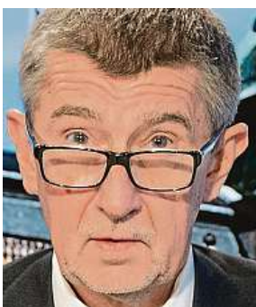
Andrej Babiš

Český premiér Andrej Babiš si telefonoval s britskou premiérkou Theresou Mayovou. „Říkal jsem jí, že nejlepším řešením by bylo, aby Velká Británie zůstala v Evropské unii. Proto jsem přesvědčen, že stojí za to vypsát nové refe-