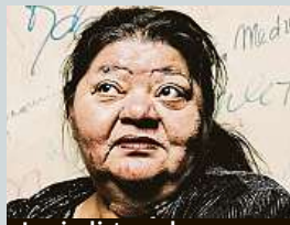
Loni v listopadu

Pohřeb zpěvačky Věry Bílé bude v sobotu 23. března v rokokanském kostele Panny Marie Sněžné. Poslední rozloučení doprovodí kromě bohoslužby v kostele na náměstí i hudba několika kapel. Rozloučit se s ní přijedou Romové z ČR, Slovenska i dalších států Evropy. Bílá byla na přelomu tisíciletí nejznámější zpěvačkou z Česka ve světě, před lety vyprodala i pařížskou Olympii. Po 15 letech se chtěla vrátit na pódia, a to s Janem Bendigem. Ten oznámil, že turné nakonec i po smrti Bílé bude.