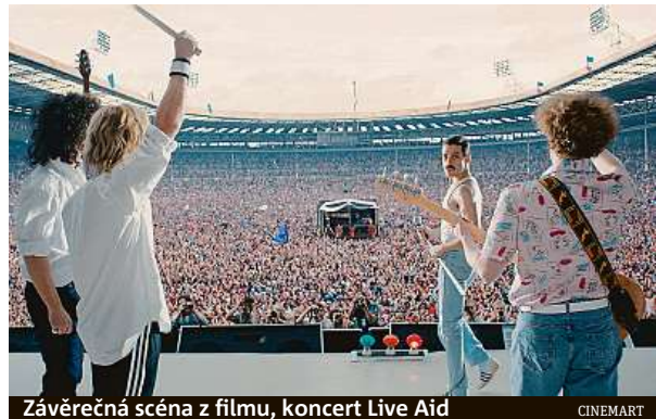
Závěrečná scéna z filmu, koncert Live Aid

Bohemian Rhapsody se nejspíš stane nejprodávanějším diskem posledních let.