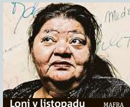
Loni v listopadu