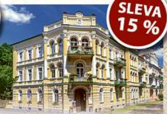
Lázeňský hotel *** METROPOL