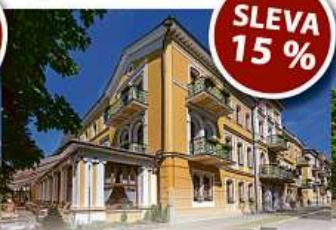
Lázeňský hotel *** BELVEDERE