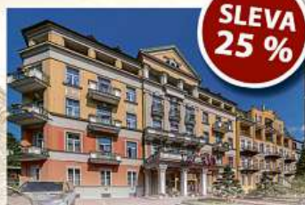
Lázeňský hotel **** PAWLIK - AQUAFORUM