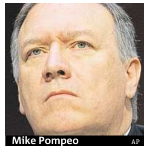
Mike Pompeo

ministrem zahraničí. Odvede fantastickou práci! Díky Rexi Tillersonovi za jeho služby! Gina Haspelová se stane novou ředitelkou CIA a první že-