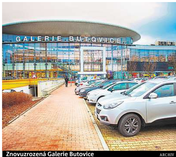
Znovuzrozená Galerie Butovice

„Máme radost, že otevření renovované Galerie můžeme oslavit spolu s našimi zákazníky, chceme tímto poděkovat těm stávajícím a přivítat všechny nové ze širokého okolí. Připravili jsme pro ně bohatý program plný hvězd a také night shopping se skvělými nabídkami anebo možností cvičit ve fitness centru