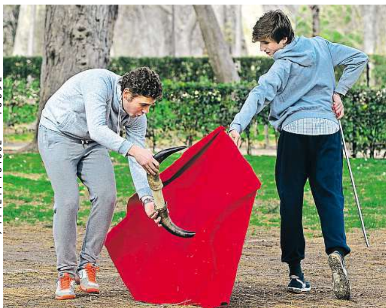
Korida. V madridském parku dva mladíci pilují techniku na býčí zápasy.