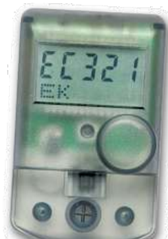
VIPA EC Radio

Jednotkový suchoběžný elektronický vodoměr