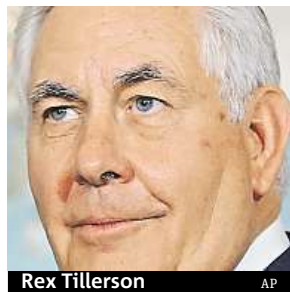
Rex Tillerson

Tillerson se včera vrátil z cesty po afrických zemích, kterou o den zkrátil. Do Washingtonu přiletěl jen několik hodin před Trumpovým oznámením. „Mike Pompeo, ředitel CIA, se stane našim