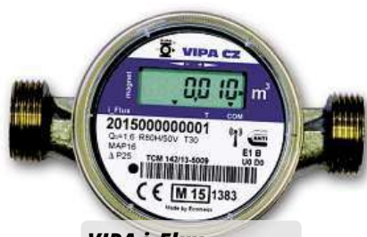
VIPA i Flux

Systém měření a výpočtu úhrady za vytápění