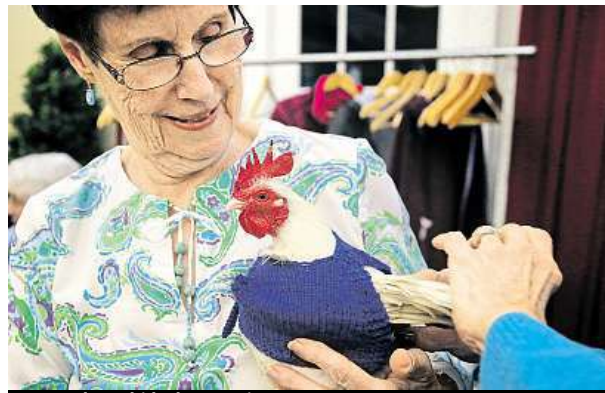
Svetr dostal i kohout Prince Peep.

Lidé jim říkají, že by měly dělat něco pro lidi. Dámy se ale věnují ptákům.