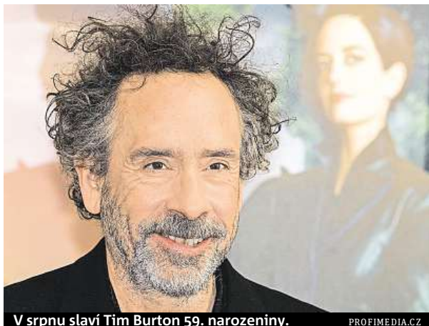
V srpnu slaví Tim Burton 59. narozeniny.

Dá se to tak říct, je to opravdu jejich součástí. Jako když