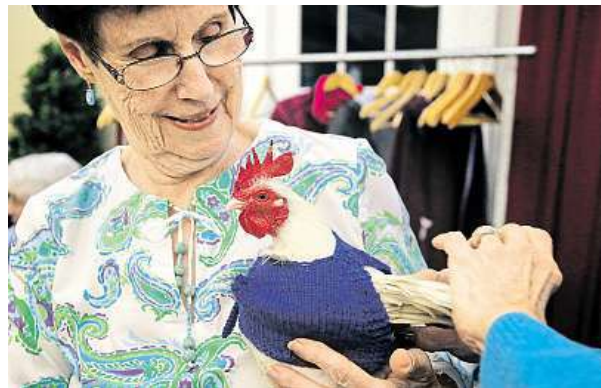
Svetr dostal i kohout Prince Peep.

Lidé jim říkají, že by měly dělat něco pro lidi. Dámy se ale věnují ptákům.