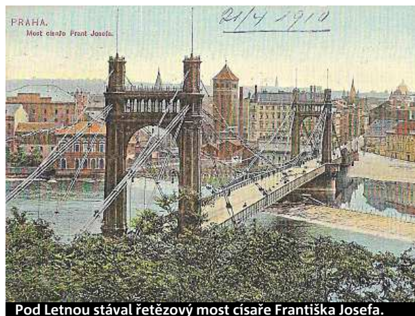
Pod Letnou stával řetězový most císaře Františka Josefa.