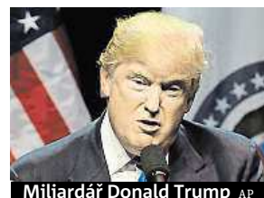
Miliardář Donald Trump

Odpůrci favorita republikánského nominačního klání Donalda Trumpa o sobě dali vědět.