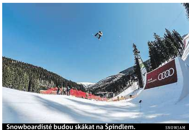
Snowboardisté budou skákat na Špindlem.