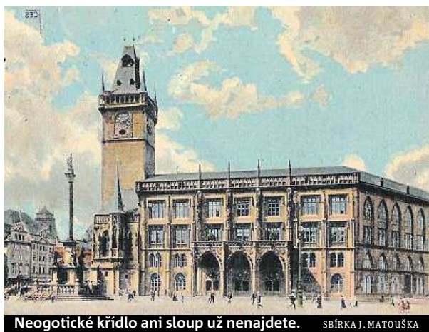
Neogotické křídlo ani sloup už nenajdete.