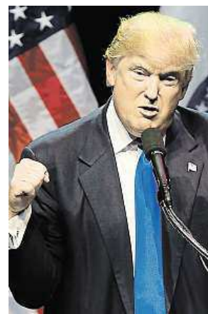
Miliardář Donald Trump

Odpůrci favorita republikánského nominačního klání Donalda Trumpa o sobě dali vědět.