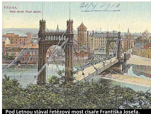
Pod Letnou stával řetězový most císaře Františka Josefa.