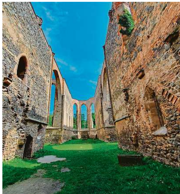
Působivá architektura dříve ženského kláštera Rosa Coeli v Dolních Kounicích na Brněnsku láká k návštěvě. MĚSTO DOLNÍ KOUNICE

Studenti Katolického gymnázia v Třebíči mohou od loňského října využívat nové učebny pro výuku odborných předmětů v oboru přírodních věd a cizích jazyků. Další opravy se týkají Biskupského dvora v Žatčanech na Brněnsku, jednoho z historických domů na petrovském návrší v Brně, chrámu svatého Ignáce v Jihlavě nebo gotického kostela svatého Jakuba v Brně.