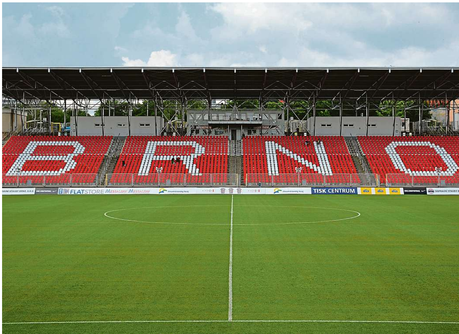
Stadion na Srbské se dočká i nového vjezdu. Vznikne díky zrušení sektorů T, U a V.