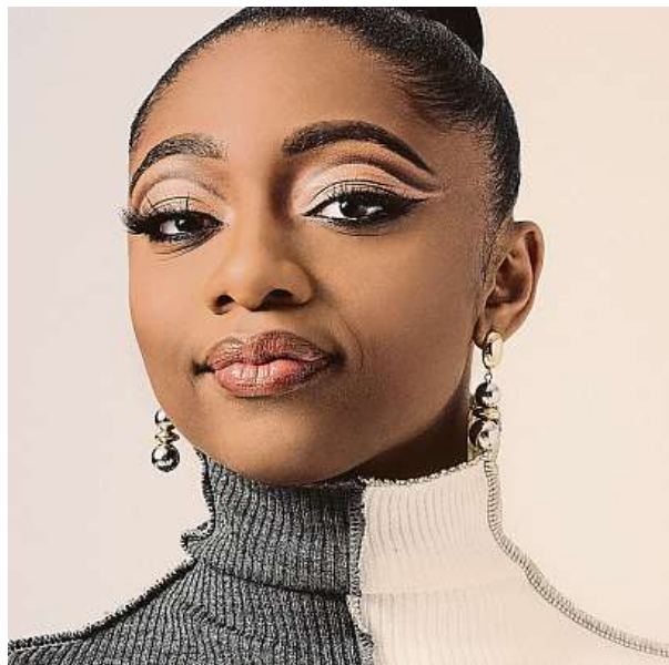
Samara Joy, nová Billie Holiday nebo Ella Fitzgerald