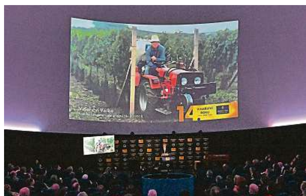
Vítězem kategorie malé vinařství se stalo vinařství Válka, nejstarší bio organické rodinné vinařství na Moravě, sídlící v Nosislavi.