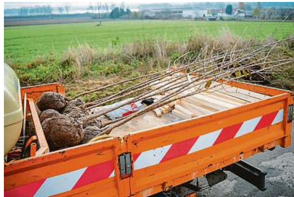
3x SÚS JMK