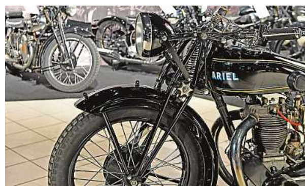
Na výstavě se prezentuje i Český Ariel klub, který v roce 2023 oslavil 20 let své existence.