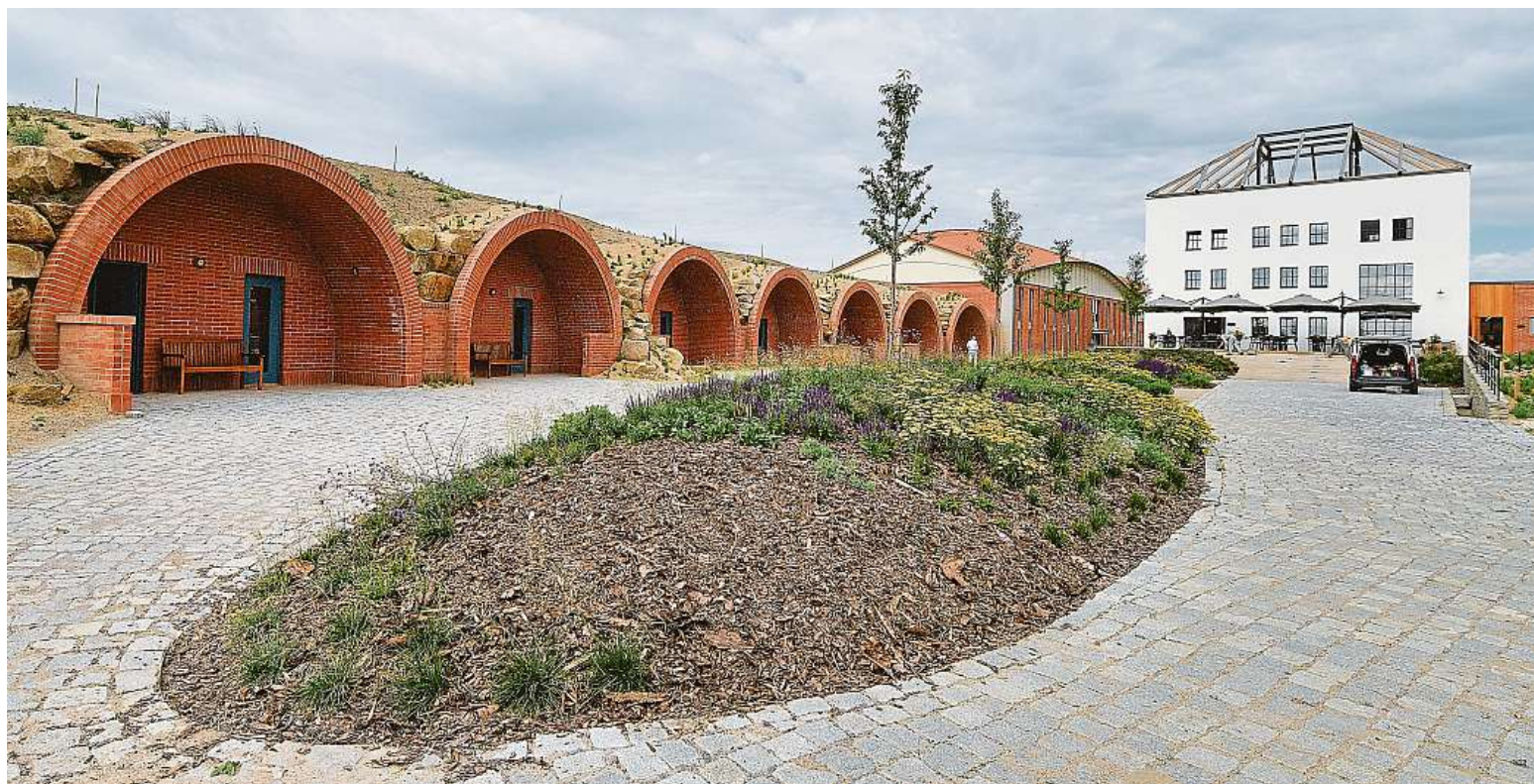
Vinařství v Havraníkách na Znojemsku zaujme také nevšedním architektonickým zpracováním celého areálu.