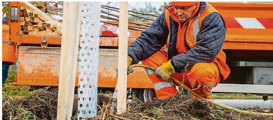
Výsadba stromů kolem jihomoravských silnic