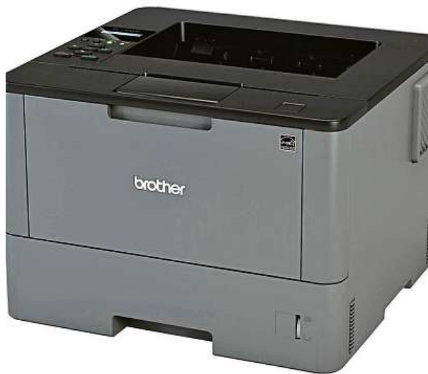
Tiskárna Brother HL-L5000D

Potřebujete tisknout text, jehož zhmotnění nesnese odkladu? Ať už to je seminárka, důležitý dokument, nebo jiný text, na kterém závisí vaše přežití, dávejte pozor na tiskárny.