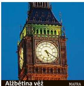
Alžbětina věž MAFRA

Od roku 2025 bude probíhat rozsáhlá rekonstrukce celého Westminsterského paláce.