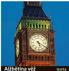
Alžbětina věž MAFRA

Od roku 2025 bude probíhat rozsáhlá rekonstrukce celého Westminsterského paláce.