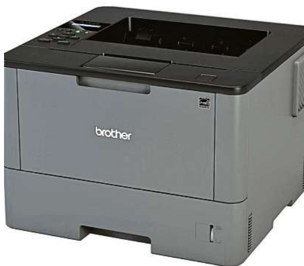
Tiskárna Brother HL-L5000D

Potřebujete tisknout text, jehož zhmotnění nesnese odkladu? Ať už to je seminárka, důležitý dokument, nebo jiný text, na kterém závisí vaše přežití, dávejte pozor na tiskárny.