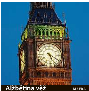
Alžbětina věž MAFRA

Od roku 2025 bude probíhat rozsáhlá rekonstrukce celého Westminsterského paláce.