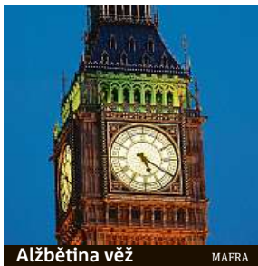
Alžbětina věž MAFRA

Od roku 2025 bude probíhat rozsáhlá rekonstrukce celého Westminsterského paláce.