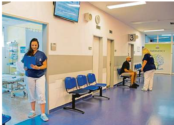
Součástí Akutní ambulance ÚVN je i ambulance LPS.

Bez dodatečných prostředků by byla lékařská pohotovost v jednotlivých zařízeních dostupná pouze tři až osm hodin denně. Díky pří-