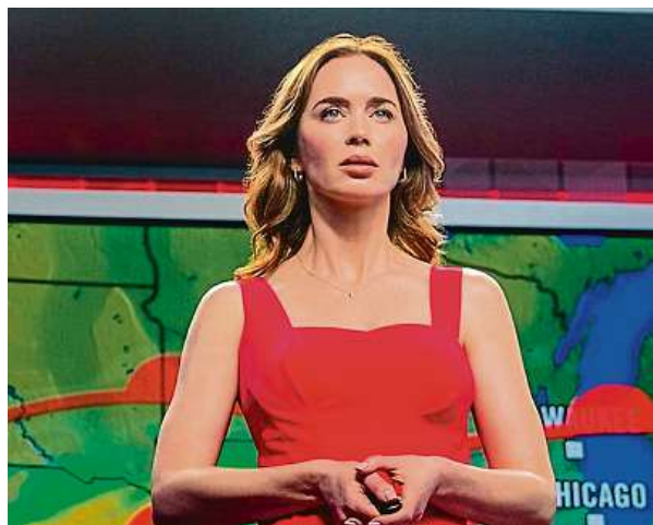
Hlavní herečkou hvězdou nové „spielbergoviny“ bude Emily Blunt. Podobnost s Blízkými setkáními i Válkou světů je také jistá.

První teaser, tedy krátká upoutávka na snímek, nazna-