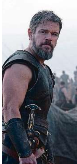
Matt Damon jako bájný hrdina