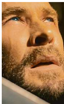
V Avengers: Doomsday se vrací i bůh Thor. FALCON