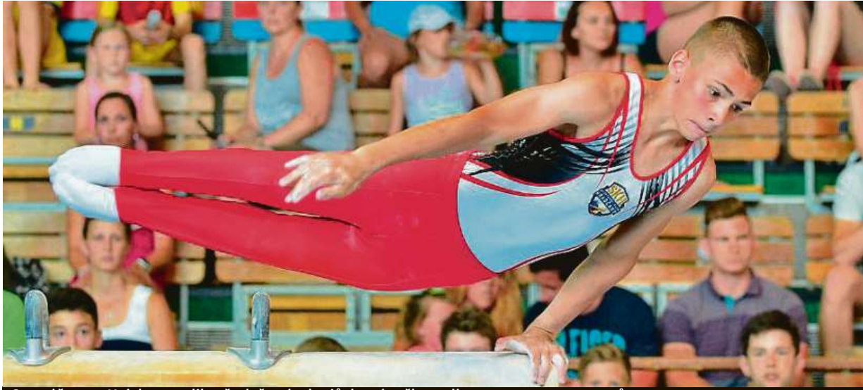
Svou účast na Hrách potvrdilo všech čtrnáct krajů, které vyšlou celkem 4.133 reprezentantů.