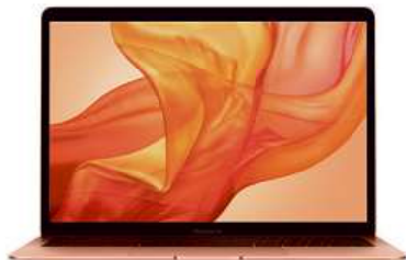
MacBook Air 128GB (2018) 35 990 Kč 29 990 Kč