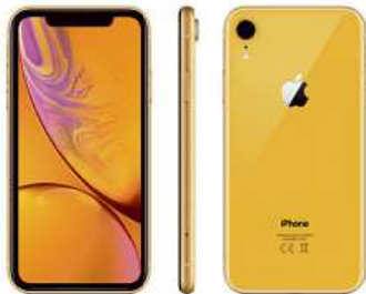
iPhone XR 22 490 Kč od 19 990 Kč