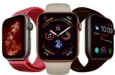
Apple Watch Series 4 11 290 Kč od 10 161 Kč