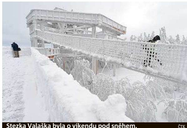
Stezka Valaška byla o víkendu pod sněhem.

Stezka vznikala se souhlasem památkářů, aby nenarušila krajinný ráz Pusteven, a stavba musela být přerušena například kvůli hnízdní ptáků. Celkové náklady dosáhnou zhruba 50 milionů korun. Jednatel společnosti Bes-