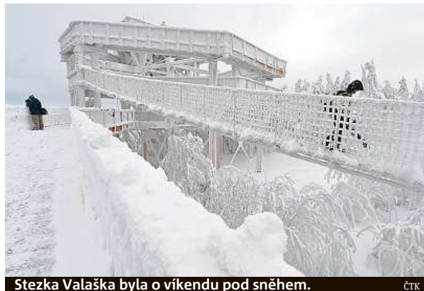
Stezka Valaška byla o víkendu pod sněhem.

Stezka vznikala se souhlasem památkářů, aby nenarušila krajinný ráz Pusteven, a stavba musela být přerušena například kvůli hnízdní ptáků. Celkové náklady dosáhnou zhruba 50 milionů korun. Jednatel společnosti Bes-