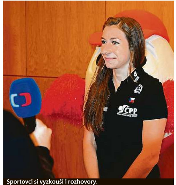
Sportovci si vyzkouší i rozhovory.