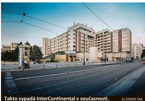
Takto vypadá InterContinental v současnosti.

„Projektu jsme dali pracovní název Staroměstská brána, protože jeho hlavní myšlenkou je vytvoření pobytově atraktivního městského prostředí s akcentem na rozšíření veřejného prostoru a jeho užitnost pro Pražany a návštěvníky Prahy. Důležité jsou dvě hlavní osy – prodloužení ulice Pařížská a rozšíření Dvořákova nábřeží,“ říká pro deník Metro Tichý a dodává, že součástí projektu je vy-