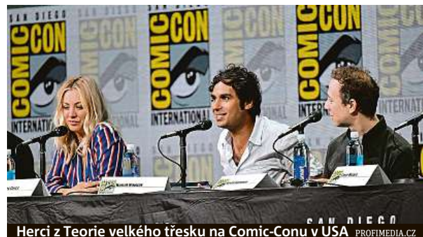
Herci z Teorie velkého třesku na Comic-Conu v USA.

„Návštěvníci budou mít jedinečnou možnost potkat tolik herců, komiksových výtvarníků a dalších umělců na jednom místě jako nikdy dříve u nás. Comic-Con Prague proběhne v termínu od 7. do 9. února 2020 v O2 universu,“ uvádějí organizátoři. Mnoho Čechů zná filmové vesmíry Star Wars, Star Treku, Harryho Pottera, Pána prstenů nebo Hry o trůny. Účast již potvrdila hvězda světového formátu Ron Perlman, představitel filmového Hellboye, běčková akční hvězda Casper Van Dien známý z Hvězdné péchoty, Ian McElhinney ze Hry o trůny, britská herečka Anna Shafferová, kterou si