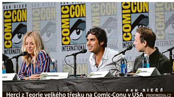
Herci z Teorie velkého třesku na Comic-Conu v USA

„Návštěvníci budou mít jedinečnou možnost potkat tolik herců, komiksových výtvarníků a dalších umělců na jednom místě jako nikdy dříve u nás. Comic-Con Prague proběhne v termínu od 7. do 9. února 2020 v O2 universu,“ uvádějí organizátoři. Mnoho Čechů zná filmové vesmíry Star Wars, Star Treku, Harryho Pottera, Pána prstenů nebo Hry o trůny. Účast již potvrdila hvězda světového formátu Ron Perlman, představitel filmového Hellboye, běčková akční hvězda Casper Van Dien známý z Hvězdné pěchoty, Ian McElhinney ze Hry o trůny, britská herečka Anna Shafferová, kterou si