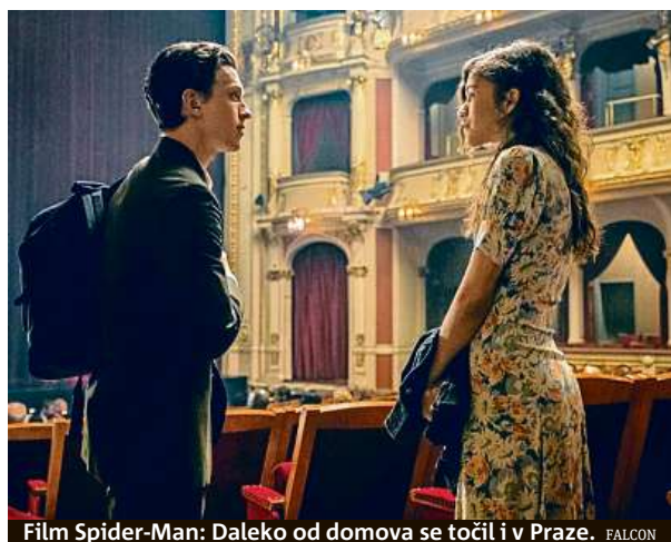
Film Spider-Man: Daleko od domova se točil i v Praze.

Na tolik korun vyjde vstupné na všechny dny Comic-Conu. Uskuteční se od 7. do 9. 2. Vstupné na jednotlivé dny vyjde na 690 či 990 korun.