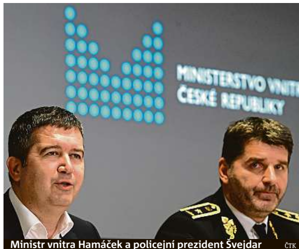
Ministr vnitra Hamáček a policejní prezident Švejdar

„Komunikace ohledně postavení útvarů a národního kriminálního úřadu probíhá a probíhat ještě bude,“ upozornil Švejdar. O tom, jak konkrétně by měl úřad vpa-