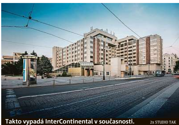
Takto vypadá InterContinental v současnosti.