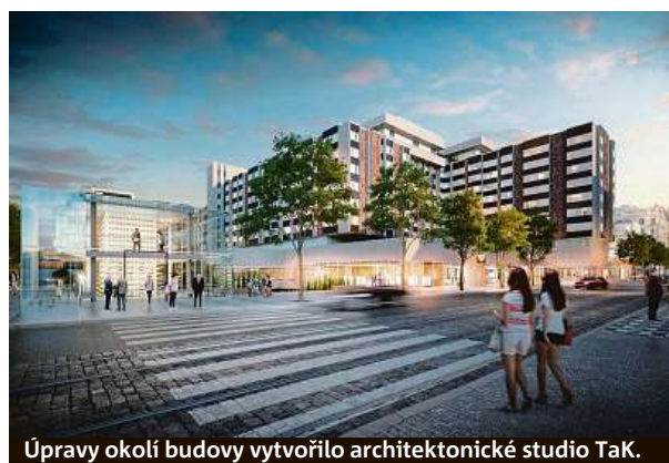
Úpravy okolí budovy vytvořilo architektonické studio TaK.

tvoření dvou nových náměstí. „Prvního z nich na ploše mezi hotelem a ulicí Bílkova, druhého na místě stávajícího bazénu a privátní zahrady hotelu. To bude sledovat úroveň historického Starého Města a propojí nové korzo s vltavskou náplavkou průchodem pod tělesem vozovky,“ dodává Tichý.