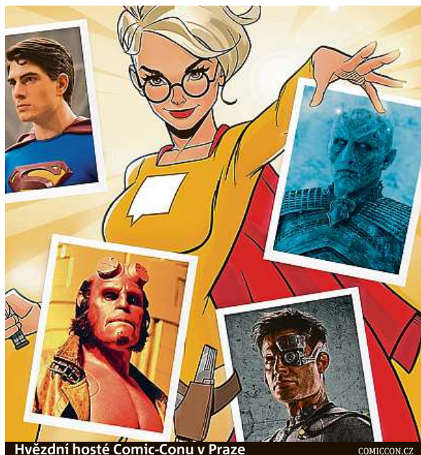
Hvězdní hosté Comic-Conu v Praze