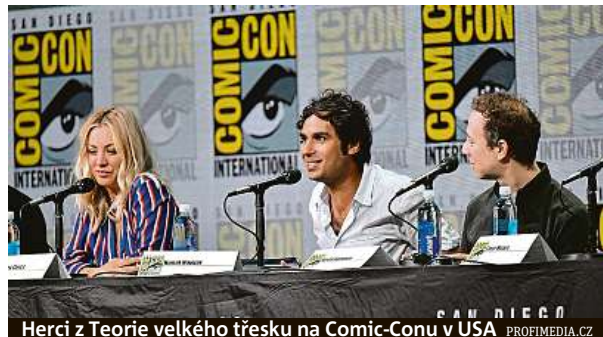
Herci z Teorie velkého třesku na Comic-Conu v USA

„Návštěvníci budou mít jedinečnou možnost potkat tolik herců, komiksových výtvarníků a dalších umělců na jednom místě jako nikdy dříve u nás. Comic-Con Prague proběhne v termínu od 7. do 9. února 2020 v O2 universu,“ uvádějí organizátoři. Mnoho Čechů zná filmové vesmíry Star Wars, Star Treku, Harryho Pottera, Pána prstenů nebo Hry o trůny. Účast již potvrdila hvězda světového formátu Ron Perlman, představitel filmového Hellboye, běčková akční hvězda Casper Van Dien známý z Hvězdné pěchoty, Ian McElhinney ze Hry o trůny, britská herečka Anna Shafferová, kterou si