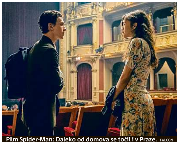
Film Spider-Man: Daleko od domova se točil i v Praze.

Na tolik korun vyjde vstupné na všechny dny Comic-Conu. Uskuteční se od 7. do 9. 2. Vstupné na jednotlivé dny vyjde na 690 či 990 korun.