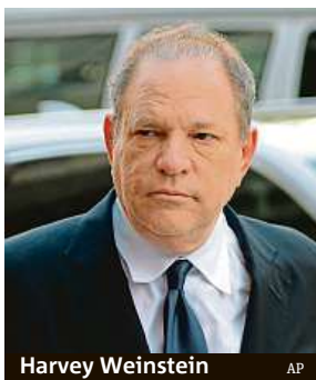
Harvey Weinstein

Americký filmový producent Harvey Weinstein, který se zodpovídá z obvinění ze sexuálních útoků a znásilnění, dosáhl dohody o odškodnění většiny svých údajných obětí.