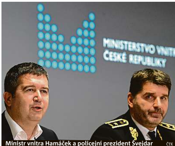
Ministr vnitra Hamáček a policejní prezident Švejdar

„Komunikace ohledně postavení útvarů a národního kriminálního úřadu probíhá a probíhat ještě bude,“ upozornil Švejdar. O tom, jak konkrétně by měl úřad vpa-