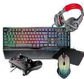
Vybavení Trust MIRONET

Těmto tahákům zdatně sekundují sluchátka Radius s virtuálním 7.1 prostorovým zvukem, který vám umožní přesně lokalizovat vaše pro-