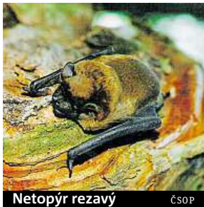
Netopýr rezavý ČSOP

V Huslíku u Po-děbrad letos vylepšili letové schopnosti 134 mláďat.