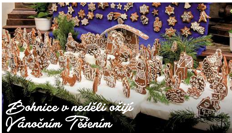
Bohnice v neděli ožijí Vánočním Těšením

V neděli 17. prosince se od 12 do 18 hodin uskuteční na náměstí před kostelem sv. Petra a Pavla ve Starých Bohnicích již 9. ročník Starobohnického vánočního těšení, který připravila radnice Prahy 8 společně s římskokatolickou farností Bohnice.