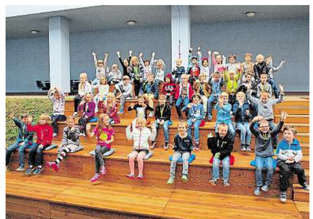
Školáci si navrhli amfiteátr pod širým nebem. PRAHA 4

„Lepší místo učí děti vnímat pojem veřejný prostor, dívat se kolem sebe,“ říká radní čtvrté městské části Jaro-