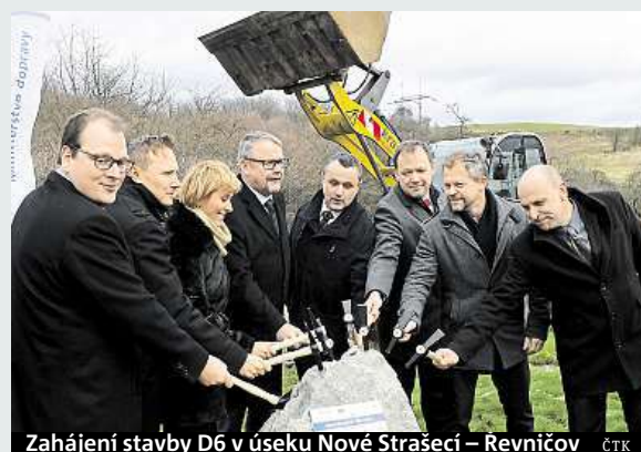
Zahájení stavby D6 v úseku Nové Strašecí – Revničov