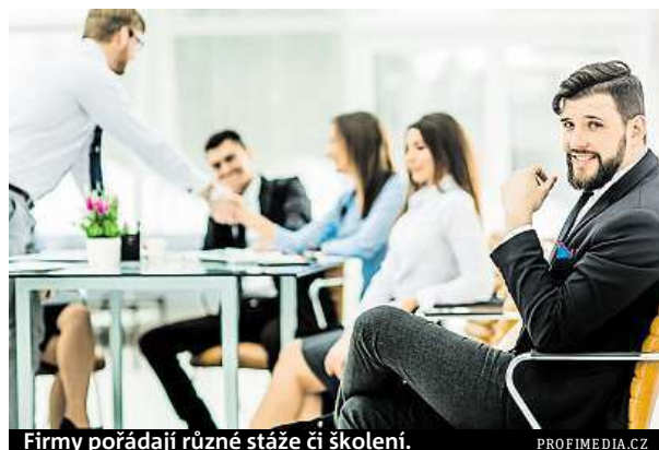
Firmy pořádají různé stáže či školení.

Celosvětové výsledky průzkumu pro první čtvrtletí jsou pozitivní a zaměstnavatelé ve 41 ze 43 zemí očekávají různou míru růstu počtu pracovních sil. ČTK