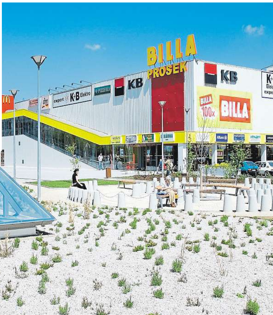
Ctyřpatrové nové záchytné parkoviště o ploše 3100 metrů čtverečních vyroste příští rok za obchodním centrem u stanice metra Prosek v Praze 9. MHMP