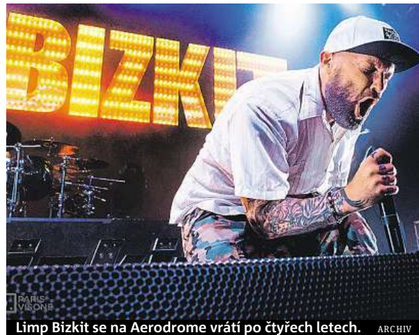
Limp Bizkit se na Aerodrome vrací po čtyřech letech.

Program festivalu se proto v příštím roce rozroste kromě dnů i na dvě pódia. Oproti