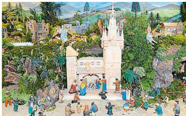
Třeštské betlémy jsou k vidění v Jindřišské věži. PRAHA 1

• 15. 12. V kostele Nejsvětějšího Srdce Páně se v pátek rozezní