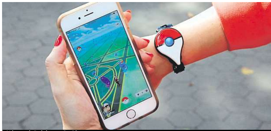
Náramek Pokémon Go Plus

Jestli mezi ně patříte i vy, máme pro vás tip na zajímavou pomůcku, jež vám chytání značně ulehčí. Jedná se o náramek Pokémon Go Plus, který se spáruje s mobilní aplikací ve vašem telefonu pomocí bluetooth. Pak můžete začít lovit pokémony revolučním způsobem.