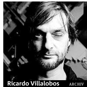
Ricardo Villalobos ARCHIV

Třídení akce bude svůj program hostit na jedné vnitřní scéně a třech venkovních. V první vlně jsou celofestivalové vstupenky k dostání za 600 korun. S blížícím se datem konání budou zdražovat. MET