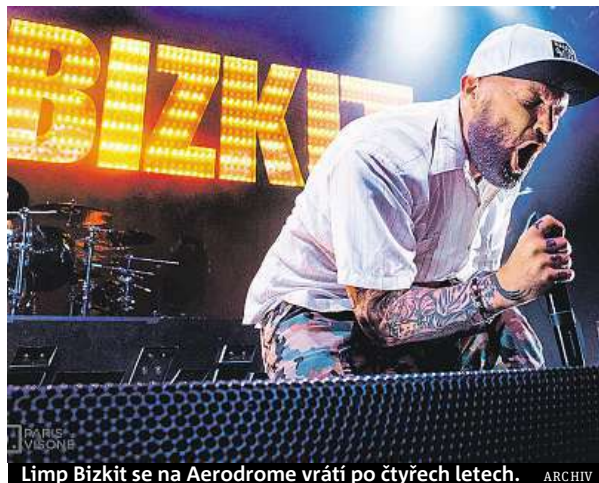
Limp Bizkit se na Aerodrome vrací po čtyřech letech.

Program festivalu se proto v příštím roce rozroste kromě dní i na dvě pódia. Oproti