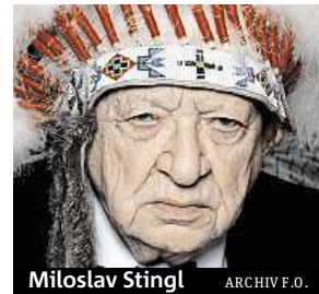
Miloslav Stingl