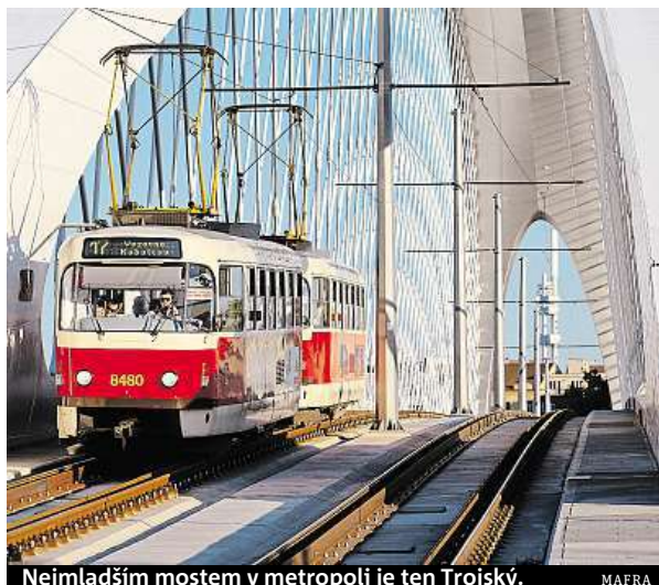
Nejmladším mostem v metropoli je ten Trojský.

Lávka bude stát mezi vstupem do holešovické tržnice a na karlínské straně naváže na páteřní cyklostezku. Uprostřed budou moci lidé sestoupit na Štvanici. Mezi Holešovicemi a ostrovem bude mít délku 149 metrů a z ostrova do Karlína dalších 38 metrů. Kdy bude lávka stát, zatím není jasné. ROBERT OPPELT