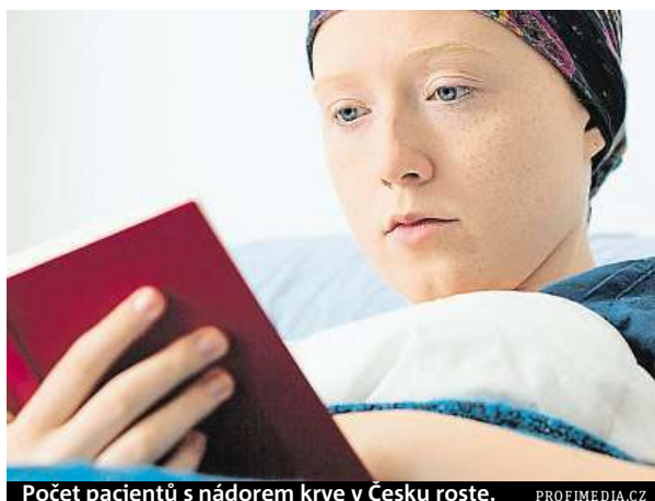
Počet pacientů s nádorem krve v Česku roste.

Podle něj se měsíční náklady jen na léky pro pacienta pohybují v rozmezí 50 až 200 tisíc korun. „V tom nejsou zahrnuty další náklady na různá specializovaná vyšetření. Potýkáme se s nedostatkem personálu, vybavením v podobě zobrazovacích přístrojů, či kapacity laboratoří. Pacienti čekají hodiny před