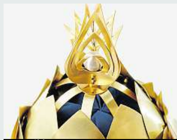
Detail koruny KRISTINA HRABĚTOVÁ

V galerii Kvalitář je ode dneška otevřena výstava, na které můžete vidět korunovační klenoty pro kambodžského krále, které navrhla mladá česká designérka Viktorie Beldová. Panovník Norodom Sihamoni, který stojí v čele asijské země od roku 2004, v minulosti studoval v Praze a dodnes umí výborně česky. Výstava v galerii na Senovázském náměstí potrvá do 6. února a otevřena je od pondělí do čtvrtka od 10 do 18 hodin a v pátek do 16 hodin.