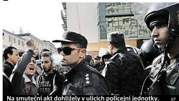
Na smuteční akt dohlížely v ulicích policejní jednotky.

V Egyptě byl po víkendovém atentátu na káhirský kostel koptských křesťanů vyhlášen třídenní státní smutek. K uctění obětí útoku se konaly modlitby. Smutečního obřadu v kostele, kde byly před oltářem seřazeny rakve s oběťmi, se včera směli zúčastnit pouze pozůstalí.