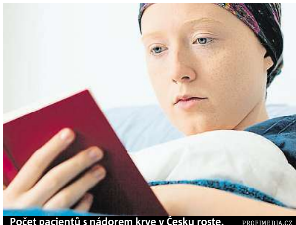
Počet pacientů s nádorem krve v Česku roste.

Podle něj se měsíční náklady jen na léky pro pacienta pohybují v rozmezí 50 až 200 tisíc korun. „V tom nejsou zahrnuty další náklady na různá specializovaná vyšetření. Potýkáme se s nedostatkem personálu, vybavením v podobě zobrazovacích přístrojů, či kapacity laboratoří. Pacienti čekají hodiny před