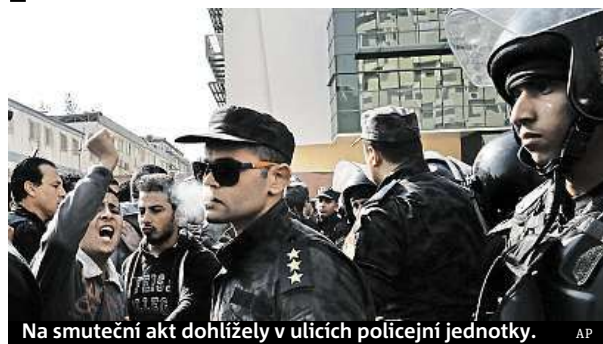
Na smuteční akt dohlížely v ulicích policejní jednotky.

V Egyptě byl po víkendovém atentátu na káhirský kostel koptských křesťanů vyhlášen třídenní státní smutek. K uctění obětí útoku se konaly modlitby. Smutečního obřadu v kostele, kde byly před oltářem seřazeny rakve s oběťmi, se včera směli zúčastnit pouze pozůstalí.