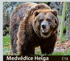
Medvědice Helga