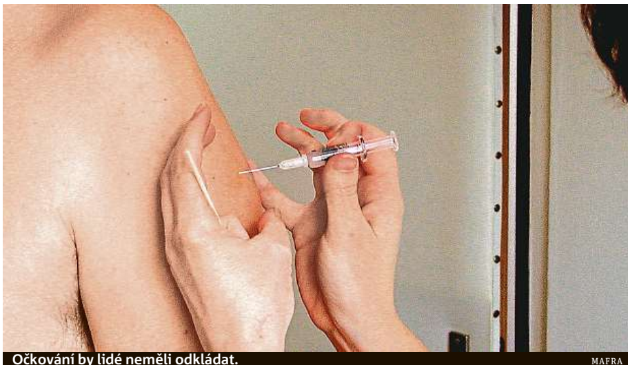
Očkování by lidé neměli odkládat.

Očkování by ale měli podstupovat i dospělí. A to ze stejného důvodu jako děti. „Očkování snižuje výskyt infekčních nemocí a komplikací s nimi