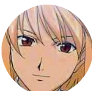
Eliška Tsunade Valkýra Ještě aby mi v hospodě balili pivo do sáčku.