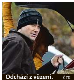
Odchází z vězení.

v podzemních nádržích v areálu firmy Moravia-Chem, kterou skrytě vlastnil Radek Březina. Poté jej odváželi odběratelům nebo do tajných skladů, spotřební daň neodváděli. Soud množství lihu vyčistil na 20,8 milionu litrů.