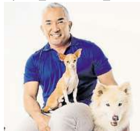
Cesar Millan.

„Když nerozumíte, co vám váš pes sděluje, budete v jeho