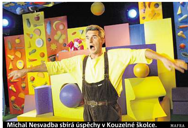
Michal Nesvadba sbírá úspěchy v Kouzelné školce.

Oblíbený strejda Michal z pořadu Kouzelná školka čili herec a mim Michal Nesvadba oslaví své 60. narozeniny. Pro tuto příležitost připravil na sobotu do Kongresového centra velkou oslavu.