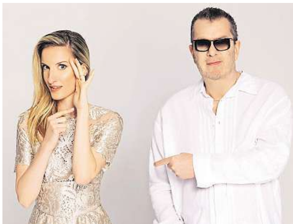
Ona a On Tour začne příští týden v Ostravě.

Adela: To určitě nebude moderovaný koncert, aby si lidé nemysleli, že budu uvádět každou písničku. Dobře, že ta