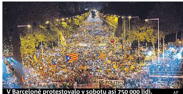
V Barceloně protestovalo v sobotu asi 750 000 lidí.

Rajoy přijel do Barcelony v bouřlivé době. Proti uvězněným několika členům sesazené katalánské vlády protestovalo v sobotu v Barceloně na 750 000 lidí. Separatistické vedení