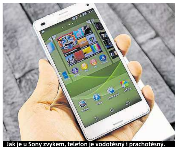
Jak je u Sony zvykem, telefon je vodotěsný i prachotěsný.

ný 4jádrový procesor Snapdragon 801, taktovaný na 2,5 GHz. Xperia Z3 Compact je díky němu ryzí dravec, což poznáte při náročných hrách či aplikacích. Chlubit se může také vynikajícím 20,7MPx fotoaparát, schopným pořizovat 4K videa plná nejméně detailů nebo dlouhou výdrž, až dva dny na jedno nabití. Z designu zaujmou nejen dominantní skleněná záda, ale i praktická stránka, jelikož, jak je u Sony zvykem, telefon je vodotěsný a prachotěsný dle norem IP65/68. Patříte-li k těm, kteří neholdují neohrabaným „pádlům“, Xperii Z3 Compact si jednoduše zamilujete.