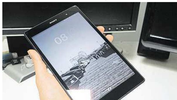
Záruka chodu bez záseků: 3 GB operační paměti 2x MIRONET