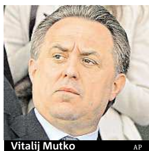
Vitalij Mutko

Světová antidopingová agentura WADA v pondělí kvůli rozsáhlému porušování antidopingového kodexu doporučila vyloučit Rusko z mezinárodní atletické asociace IAAF, což by pro ruské atlety znamenalo neúčast na všech soutěžích včetně olympijských her. IAAF bude o této možnosti jednat dnes.