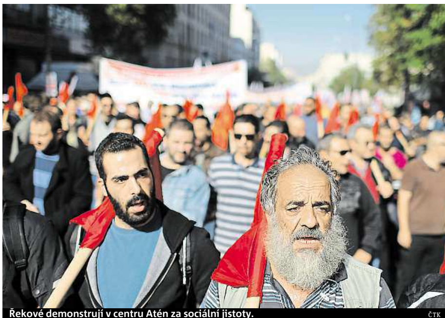
Řekové demonstrují v centru Atén za sociální jistoty.

Jen v nouzovém režimu včera pracovaly nemocnice. První generální stávka za poslední rok je zároveň prvním vážným testem pro premiéra Alexise Tsiprase, jehož levicová strana SYRIZA v lednu vyhrála volby díky slibu ukončení úsporných opatření. Nakonec však nepopulární podmínky třetího záchraného programu přijala pod hrozbou opuštění eurozóny. Svůj mandát si Tsipras