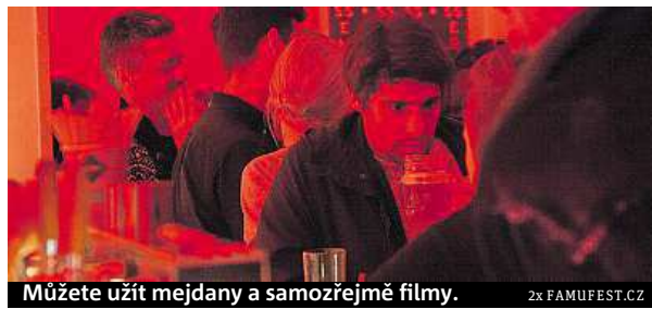
Můžete užít mejdany a samozřejmě filmy. 2x FAMUFEST.CZ