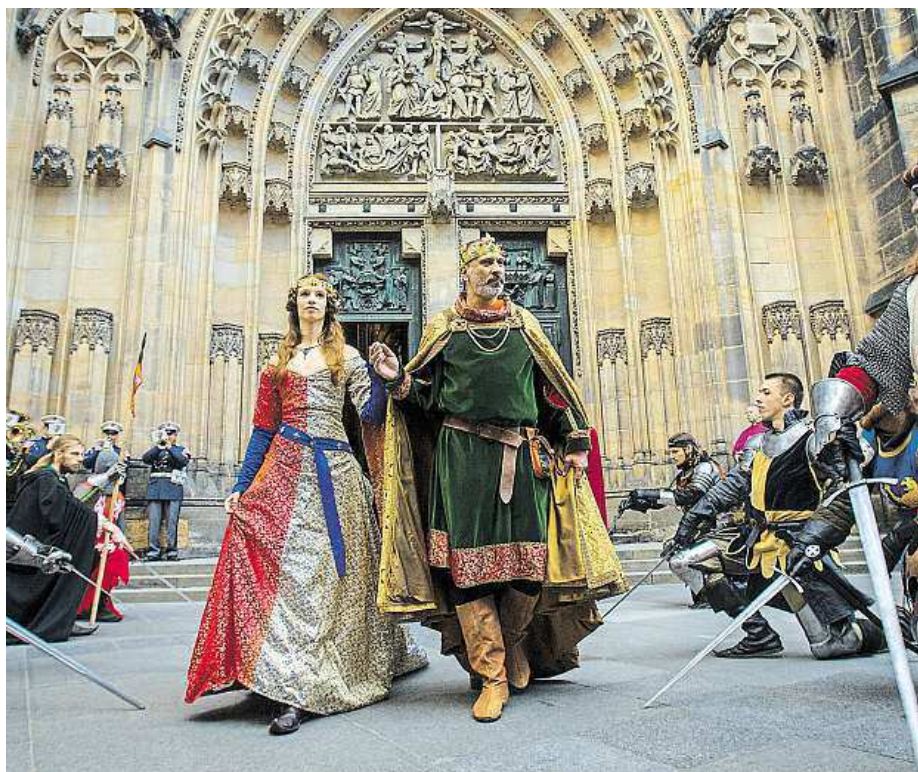
Císaře a krále Karla IV. si na Hradě připomínají pravidelně.

„Tehdejší architekturu zvláště dětem představí interaktivní výstava Architektura pro korunu,“ láká čtenáře Metra Šebek. FILIP JAROŠEVSKÝ