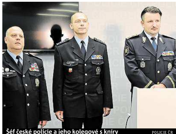
Šéf české policie a jeho kolegové s kníry