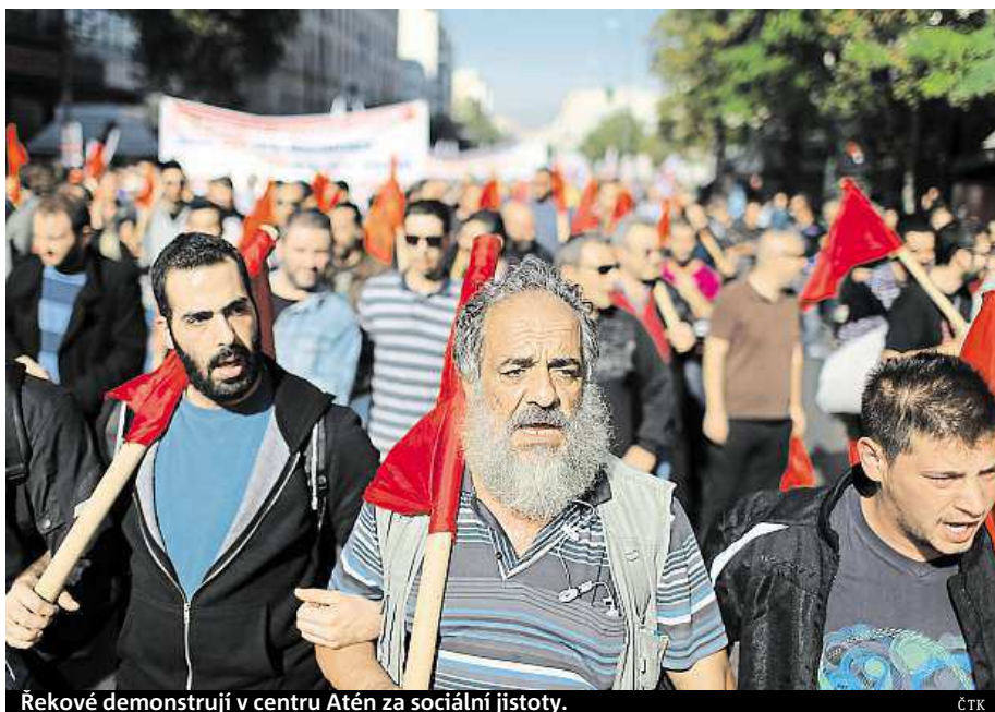
Řekové demonstrují v centru Atén za sociální jistoty.

Jen v nouzovém režimu včera pracovaly nemocnice. První generální stávka za poslední rok je zároveň prvním vážným testem pro premiéra Alexise Tsiprase, jehož levicová strana SYRIZA v lednu vyhrála volby díky slibu ukončení úsporných opatření. Nakonec však nepopulární podmínky třetího záchraného programu přijala pod hrozbou opuštění eurozóny. Svůj mandát si Tsipras