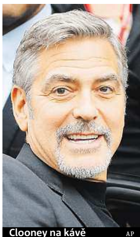
Clooney na kávě

Každý návštěvník může zaplatit horký nápoj nebo jídlo, které jsou následně podány lidem bez domova. Někdejší bezdomovci také tvoří čtvrtinu zaměstnanců kaváren Social Bite. Littlejohn po Clooneyho návštěvě řekl, že herec přispěl na charitu částkou tisíc liber (více než 38 000 Kč) a nechal v restauraci spropitné