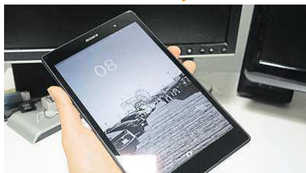
Záruka chodu bez záseků: 3 GB operační paměti 2x MIRONET