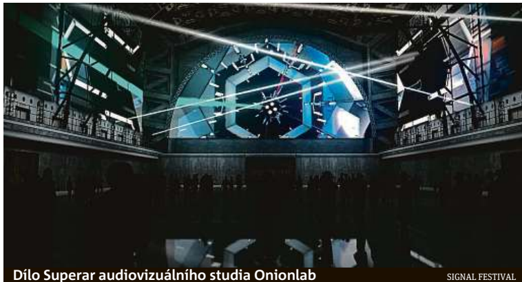
Dílo Superar audiovizuálního studia Onionlab