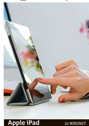
Apple iPad 2x MIRONET

Apple iPad teď zakoupíte v internetovém obchodu Mironet za 10 113 korun.