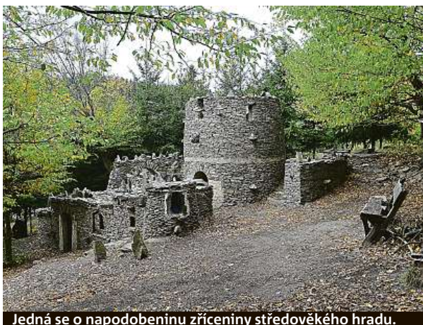
Jedná se o napodobeninu zříceniny středověkého hradu.

Činorodý senior po deseti letech dokončil malou verzi zříceniny středověkého hrádku. Dal mu název Spacírštejn.