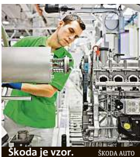
Škoda je vzor. ŠKODA AUTO

Zhruba tolik pokusů o útok na počítače zažila v roce 2020 v průměru česká organizace či firma. Obava z hackerů je v procesu digitalizace výroby jednou z největších obav firem, které se do výrazné digitalizace pouštějí. Firmám se nechce ukládat data do vzdálených cloudových systémů. Důvěru mají ve vlastní úložiště přímo ve firmě.