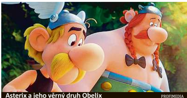
Asterix a jeho věrný druh Obelix

Asterix a gryf (Astérix et le Griffon). Tak se jmenuje komiksový příběh, který se odehrává na pomezí východní Evropy a Asie. „Slavná dvojice Asterix a Obelix tentokrát pomáhá Sarmatům, nepříteli známému antickému kočovnému národu, jejichž symbolem je právě mytické zvíře gryf, napůl lev a napůl orl,“ oznámilo vydavatelství Hachette.