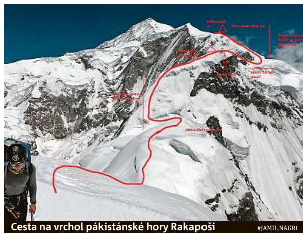
Cesta na vrchol pákistánské hory Rakapoši

„Co se týká cestovního pojištění, tak obdobná expedice jako ta v Pákistánu se u nás běžně pojistit nedá,“ upozorňuje mluvčí ČSOB pojišťovny