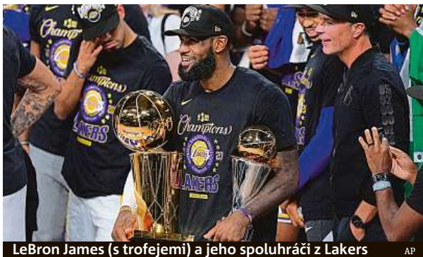
LeBron James (s trofejemi) a jeho spoluhráči z Lakers

Basketbalovou NBA ovládl tým z Los Angeles s hvězdným LeBronem Jamesem.