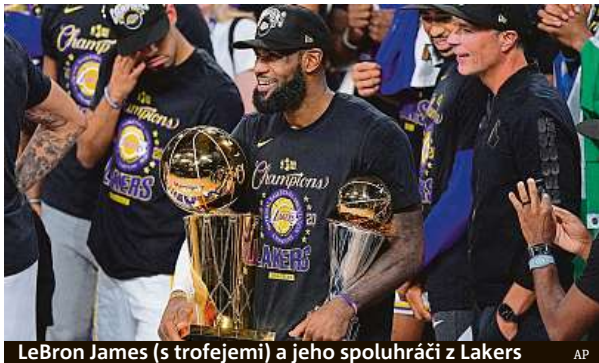
LeBron James (s trofejemi) a jeho spoluhráči z Lakers

Basketbalovou NBA ovládl tým z Los Angeles s hvězdným LeBronem Jamesem.