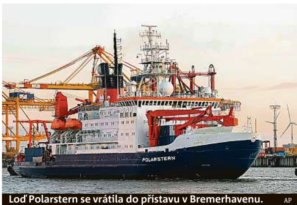
Loď Polarstern se vrátila do přístavu v Bremerhavenu.

Obrovské množství údajů, které mezinárodní týmy odborníků za měsíce plavby kolem severního pólu nashromáždily, jim však umožňují vydat svědectví o klimatických změnách. „V průběhu léta mohli vědci zmapovat rozsah tání pobřežního ledu v tomto regionu považovaném vědci za epicentrum glo-