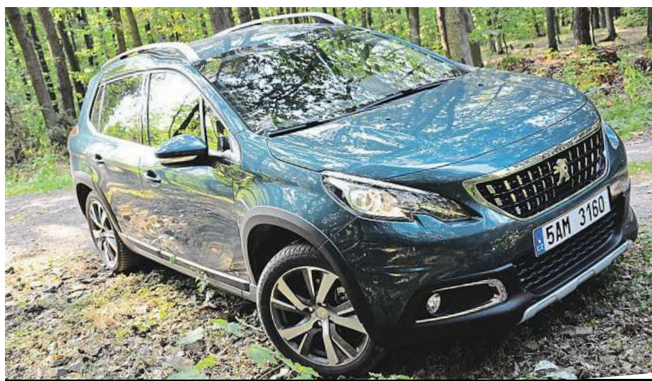
Není to zrovna offroad, ale kde byste se s normálním už báli, s ním nemusíte.