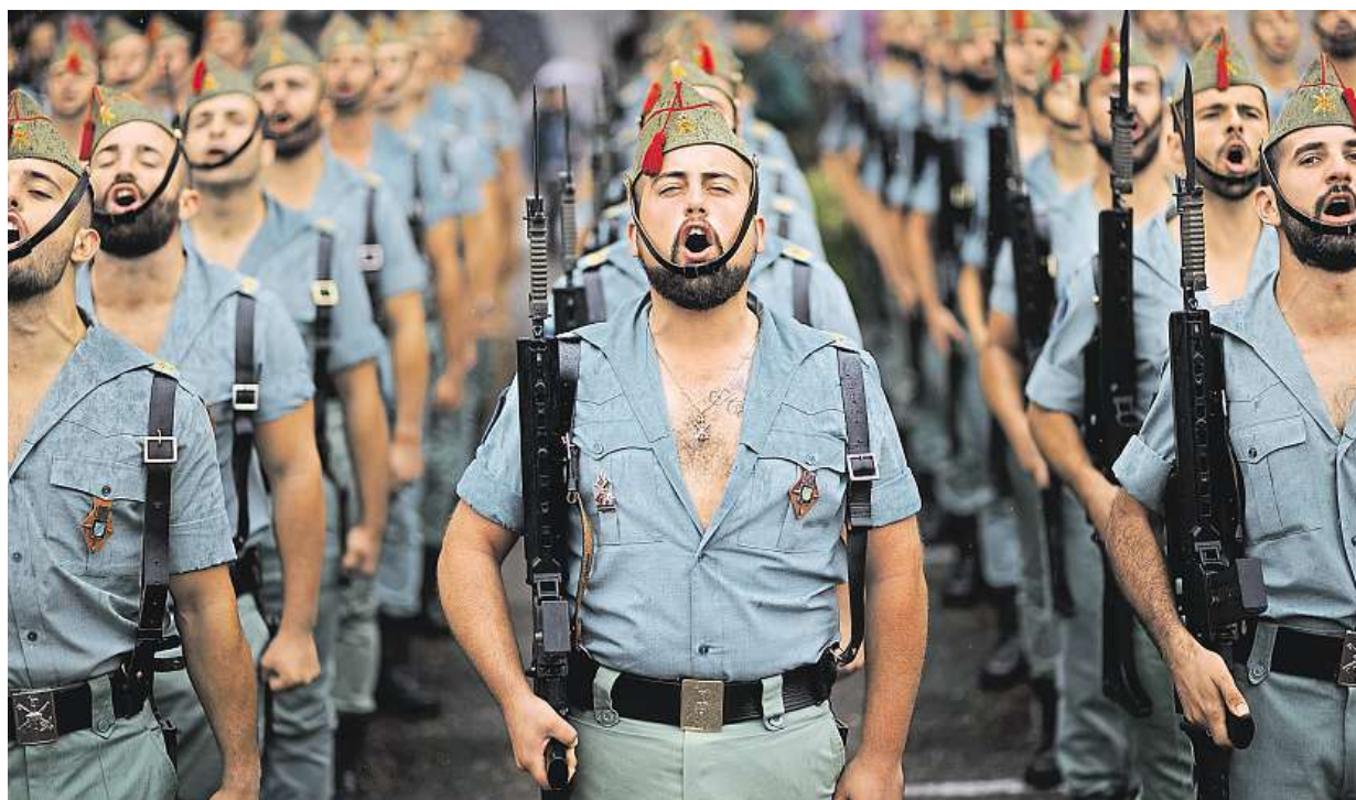
Členové elitní jednotky španělské armády La Legion se včera v Madridu připojili k oslavám Dne hispánských národů.

Mizivý efekt. Ekonomická výhodnost letního času je nízká, má vliv i na spánek. Jiné priority. Na vládě přesto návrh na jeho zrušení neprošel. Evropská komise. Letní čas je nutný i pro fungování vnitřního trhu STRANA 2