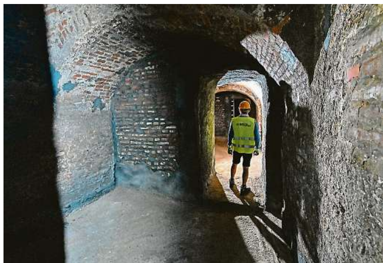
Podzemí Kapucínského náměstí