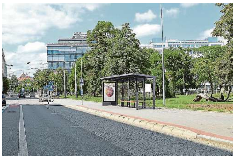
Vizualizace zastávky na Moravském náměstí