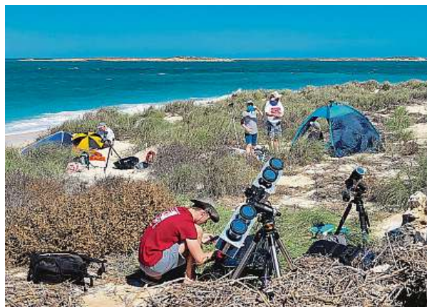
Jeden z týmů fotografoval zatmění Slunce z pustého bezjmenného ostrůvku.

Důkazem je paměťový disk se dvěma terabyty dat, která následující týdny pomocí svých softwarů zpracovával