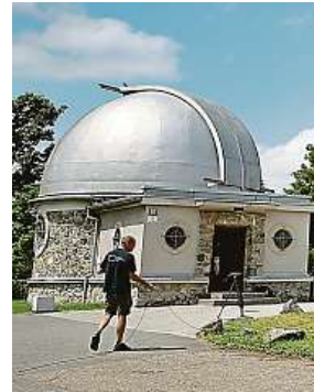
Hvězdárna a planetárium Brno na Kraví hoře

Ano, výstava se vždy přizpůsobuje daným prostorům. V Brně budeme ve velké prosklené místnosti s vysokými stropy. Je to úplně jiné než v Bruselu či v Praze. Text bude tentokrát jen v češtině, anglický překlad bude k dispozici přes QR kód. Opět vystavíme texty, které vzejdou z dílen, a to od žáků ze dvou škol v Brně a jedné v Podivíně. Budou to opět aforismy žáků devátých tříd základních škol o lidství. Moc se na