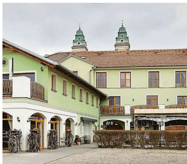
Rodinný penzion se nachází přímo v historickém centru Valtic. Nabízí celkem třináct pokojů.

Pro hosty dělá první poslední V penzionu, který se jako jediný ve Valticích může pyšnit čtyřmi hvězdičkami, je pro hosty k dispozici několik typů ubytování – od jednolůžkového pokoje až po apartmán s kuchyňkou. Všechny pokoje jsou zařízené ve stejném duchu, na stěnách visí