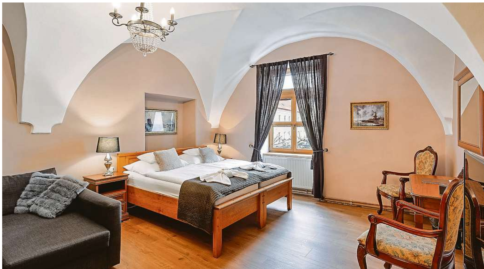
Stěny pokojů zdobí historické fotografie.