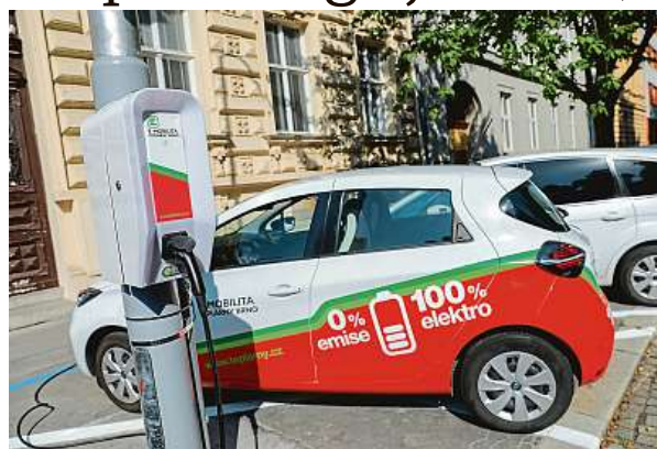
Během dobíjení není třeba platit za parkování.

Volba na stožár na třídě Kapitána Jaroše 19 padla především kvůli snadné dostupnosti parkovacího místa. Teplárny společně s TSB mají už