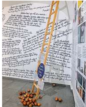
Takto vypadala výstava ve Štefánikově hvězdárně v Praze.

Máme reakce už z Bruselu, kde jsme uvedli výstavu poprvé loni v rámci českého předsednictví v Radě Evropské unie. V Praze jsme měli výstavu čtyři měsíce ve Štefánikově hvězdárně. Každý výstavu vnímá trochu jinak. Za to jsem ale ráda, protože umění, tedy i texty a literatura, je subjektivní. Lidé jsou nadšení, že pracujeme také s mladou generací a že pořádáme školení pro pedagogy, které se zabývá