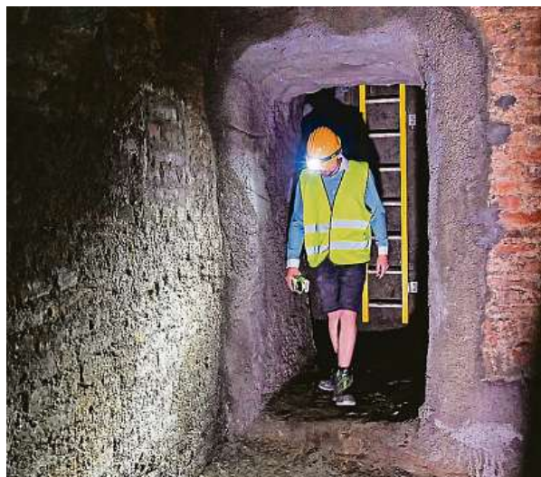
Ke znovuoživení těchto sklepních prostor došlo až na začátku 90. let minulého století.

Soustava pěti sklepních prostor o celkové rozloze přesahující sto metrů čtverečních na Kapucínském náměstí 2/4 se nachází až pod úrovní sklepů bloku. Do konce 19. století tvořily tyto sklepy součást původních tří budov s dvorními křídly. Po jejich demolici byl v letech 1901 a 1902 vystavěn současný objekt podle projektu Ferdinanda Hracha. Části prostor pod zemí byly jen zasypané a zavezeny stavební suti a zeminou. Ke znovuoživení těchto