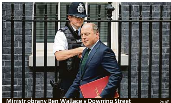
Ministr obrany Ben Wallace v Downing Street

kladě pondělního hlasování v parlamentu, které ji k tomu zavázalo. Píše se v ní o výrazném zdražení elektřiny, pro-