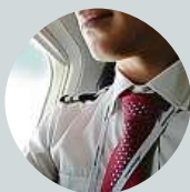
Miroslav Konečný Vždy platím kontaktně v naturálních.