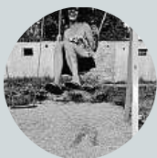
Ilona Grussmannová Platím mobilem. Všude.