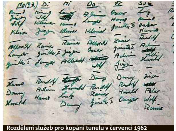
Rozdělení služeb pro kopání tunelu v červenci 1962

nyní osmdesátiletý důchodce. Rychle se podařilo najít i místo v poškozené továrně na západní straně zdi rozdělené ulice Bernauer Strasse. „Kde bude konec tunelu, bylo jedno. Důležité bylo, že jsme našli místo, kde jsme mohli začít kopat a jež nebylo sledováno,“ říká. Skupina sehnala výpomoc mezi známými a studenty. Za dva tři týdny už bylo pomocníků kolem 30, takže pracovali nepřetržitě ve třech směnech.