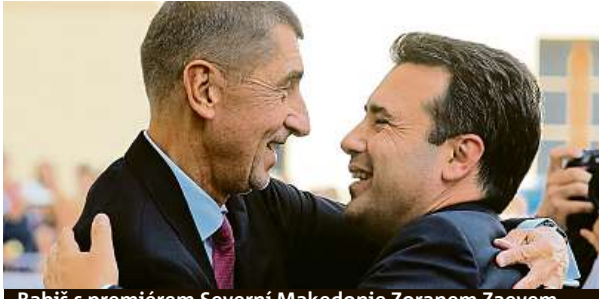
Babiš s premiérem Severní Makedonie Zoranem Zaevem

Státy střední Evropy se díky postům v EU cítí na starém kontinentě silněji.