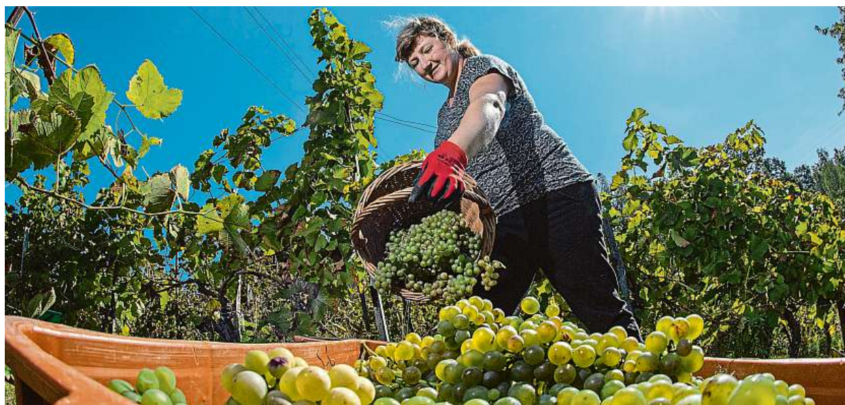
Na vinici v Litoboři na Náchodsku začala sklizeň prvních hroznů letošní úrody.

Od zítřka nová pravidla. Ověřování bezkontaktních plateb nařizuje EU. Chytré telefony. Problémy se jich nedotknou. Další změny. České banky umožní bez potvrzení kódem zaplatit částku do 1250 korun STRANA 4