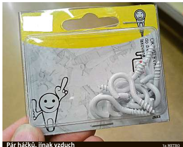
Pár háčků, jinak vzduch