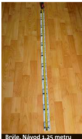
Brýle. Návod 1,25 metru