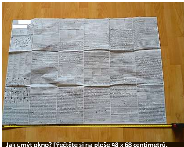
Jak umýt okno? Přečtěte si na ploše 98 x 68 centimetrů.