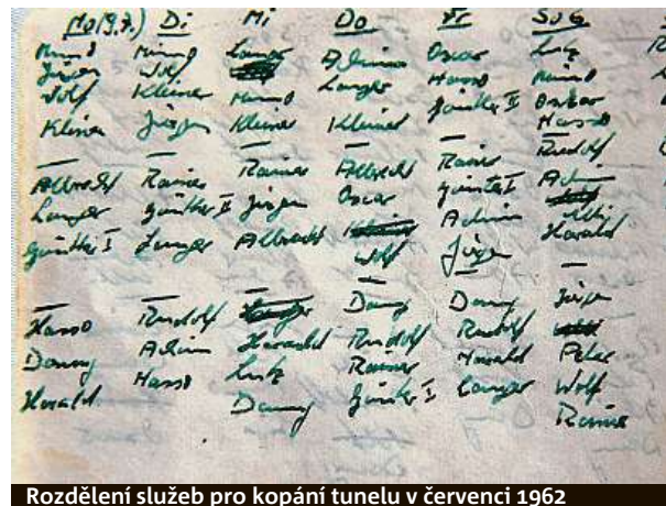
Rozdělení služeb pro kopání tunelu v červenci 1962