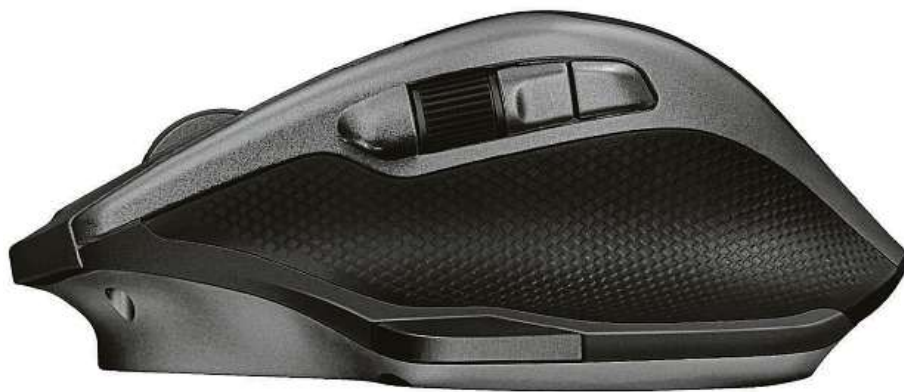
Ergonomická i elegantní myš Trust

Vestavěná baterie myši se nabíjí přes USB-C konektor, kterým můžete v případě potřeby myš také připojit. Trust EVO-RX Advanced pořídíte v internetovém obchodě Mironet za 1499 korun.