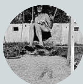
Ilona Grussmannová Platím mobilem. Všude.