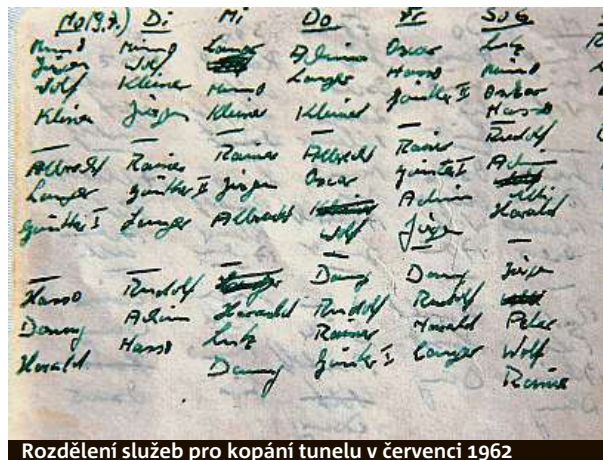
Rozdělení služeb pro kopání tunelu v červenci 1962

nyní osmdesátiletý důchodce. Rychle se podařilo najít i místo v poškozené továrně na západní straně zdi rozdělené ulice Bernauer Strasse. „Kde bude konec tunelu, bylo jedno. Důležité bylo, že jsme našli místo, kde jsme mohli začít kopat a jež nebylo sledováno,“ říká. Skupina sehnala výpomoc mezi známými a studenty. Za dva tři týdny už bylo pomocníků kolem 30, takže pracovali nepřetržitě ve třech směnech.