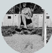
Ilona Grussmannová Platím mobilem. Všude.