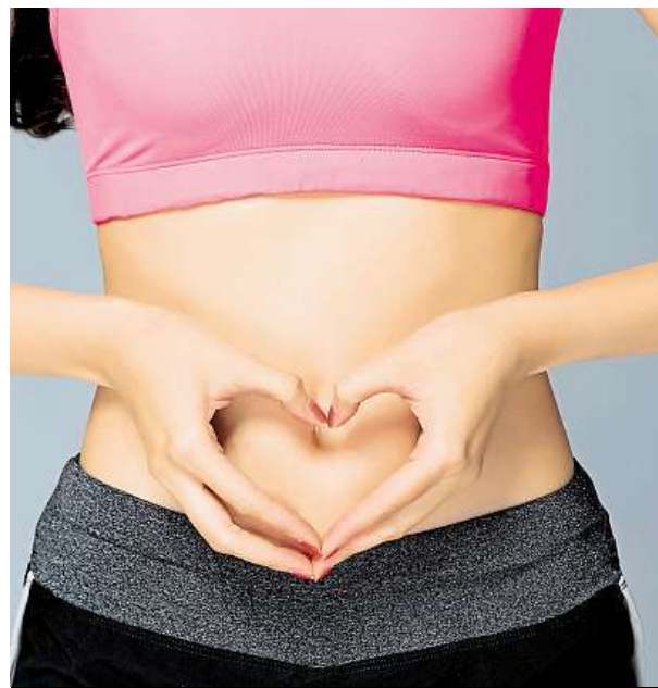
Nepodceňujte ani poporodní splín, radí lékaři.

Těhotenství a porod jsou velkou zátěží i pro pokožku. Po porodu ženy často trpí vytahanou kůží v okolí břicha nebo malými načervenalými jizvami, takzvanými striemi. Tyto malé prasklinky vznikají většinou na břichu, bocích a prsou. Přestože se vzniklých strií již nelze definitivně zbavit, výběrem správné stravy lze jejich vznik předejít. IDNES.cz