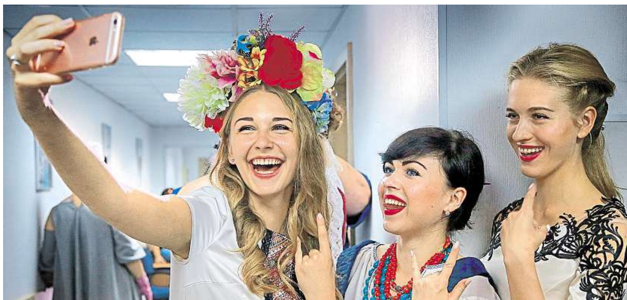
Modelky se fotily před přehlídkou ukrajinských návrhářů v Kyjevě. Ti se za pár dní poprvé představí v Kanadě.

Kupujete auto? Vláda jedná o návrhu finančního příspěvku na pořízení vozidla, které tolik nezatěžuje životní prostředí. Odkdy? Dotace by měly platit od příštího roku, obce a kraje je dostanou již letos STRANA 2