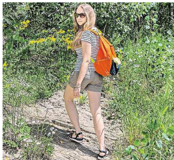
Po pohybu v přírodě se dobře prohlédněte.

Pojem aktivita klíšťat představuje podíl klíšťat, jež jsou připravena přísát se na hostitele. Do vyšších pater bylinné vegetace a trav vystupuje