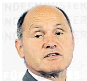
Wolfgang Sobotka AP

Někteří voliči si nyní stěžovali na problémy s lepidlem na obálkách, do nichž měli vkládat korespondenční hlasy. Obálky se rozlepují, což by vedlo k neplatnosti hlasu.