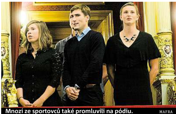
Mnozí ze sportovců také promluví na pódiu.

Setkání nazvané Vzpomínání na Věru Čáslavskou se konalo bez účasti veřejnosti