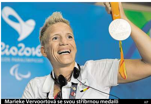
Marieke Vervoortová se svou stříbrnou medailí

Ona sama trpí degenerativním onemocněním páteře a svalů, které jí diagnostikovali už v patnácti letech. „Mám progresivní onemocnění. Každým rokem je to horší. Musím se postupně vzdávat věcí. Kdybyste mě viděli před rokem, tak jsem mohla malovat překrásné věci. Teď už nemohu. Vidím tak na dvacet procent. Co přijde přistě?