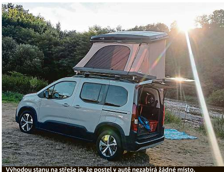
Výhodou stanu na střeše je, že postel v autě nezabírá žádné místo.