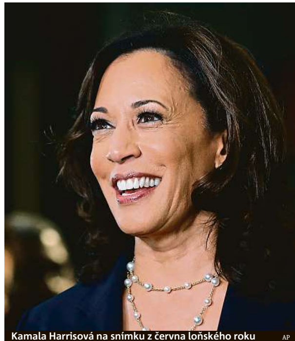
Kamala Harrisová na snímku z června loňského roku

Bývalá kalifornská generální prokurátorka a někdejší okresní státní zástupkyně v San Francisku je velkou kritičkou prezidenta Trumpa. V kampani mimo jiné prosazovala zdravotní péči pro všechny a legalizaci příležitostného užívání marihuany. Prezentovala se jako sjednocující kandidátka, která umí oslovit zástupce menšin, mladě demokratické voliče i další. Prezident Donald Trump řekl, že ho volba Harrisové překvapila. „Jeden z důvodů, proč jsem překvapený, je to, že byla na Joea Bidena zlá jako Pocahontas. Chovala se velmi neuctivě... a je těžké vybrat někoho, kdo nemá úctu. V primárkách si vedla velice bídně,“ řekl. ČTK a MET