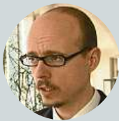
Zuzana Čaputová ukazuje, že slušnost nemusí být slabost.

f Co si myslíte o slovenské prezidentce?