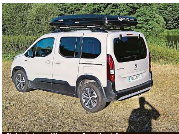
Složený stan zvýší auto o 28 centimetrů.

A musí mít zpevněnou střechu i samotný vůz? „Není to třeba, běžně jej upevnit na střechu při dynamickém zatížení od 80 do 90 kilo u osobních vozů. Jde tedy o maximální zatížení střechy za jízdy. V případě statického zatížení je nosnost mnohonásobně vyšší. U Hussarde Quatro se váha ještě rozloží na střechu a opřený žebřík,“ říká deníku Metro obchodní