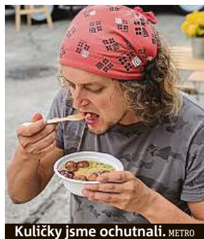
Kuličky jsme ochutnali. METRO

„Denně vydáváme tak tři-cítku porcí. Některým tam ale maso chybí. Ve čtvrtek tu budeme naposledy. Pak se stěhujeme na okraj metropole Zličín,“ sdělila nám obsluha food trucku, ve kterém jsme si v areálu Radlické kulturní sportovní kuličky zakoupili.