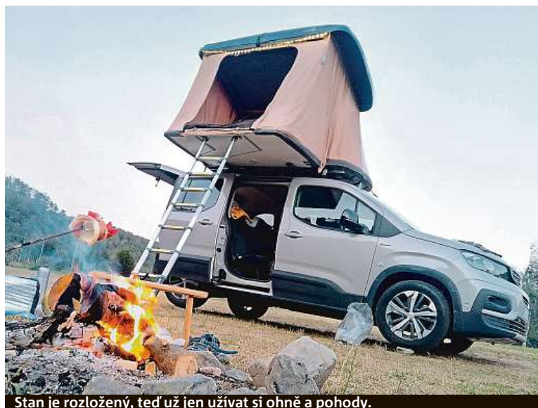
Stan je rozložený, teď už jen užívat si ohně a pohody.