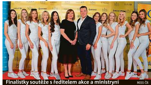
Finalistky soutěže s ředitelem akce a ministryní

Cílem čtyřdenní akce Křehká krása byla podpora prodeje jablonecké bižuterie – kvůli poklesu zahraničního turismu jsou totiž místní firmy zaměřené na výrobu těchto tradičních českých výrobků nyní v ohrožení. Na její odstartování se dostavili významní hosté. MET