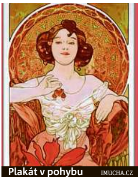
Plakát v pohybu

Originály plakátů tentokrát doplní jejich digitální podoba, která umožní některé z nich rozpohybovat. „Kromě rozšíření sbírky o zhruba sedm desítek originálních artefaktů jsme při koncipování výstavy použili i nejmodernější technologie, díky kterým motivy více než sto let starého díla Alfonse Muchy doslova ožívají. Je toho však mnohem více, co návštěvníky ohromí, například k nim promluví sám Alfons Mu-