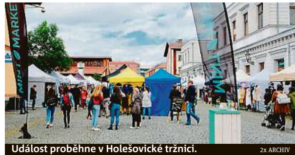
Událost proběhne v Holešovické tržnici.

Do Prahy letos zavítá podobné. Akce je bezbariérová, čtyřnozí společníci jsou vítáni. Náladu navodí DJ Uří Da Man. Vstup je zdarma. Více na mintmarket.cz . HAL