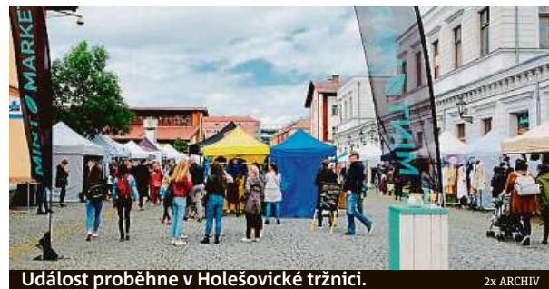
Událost proběhne v Holešovické tržnici.

Do Prahy letos zavítá podobné. Akce je bezbariérová, čtyřnozí společníci jsou vítáni. Náladu navodí DJ Uří Da Man. Vstup je zdarma. Více na mintmarket.cz . HAL