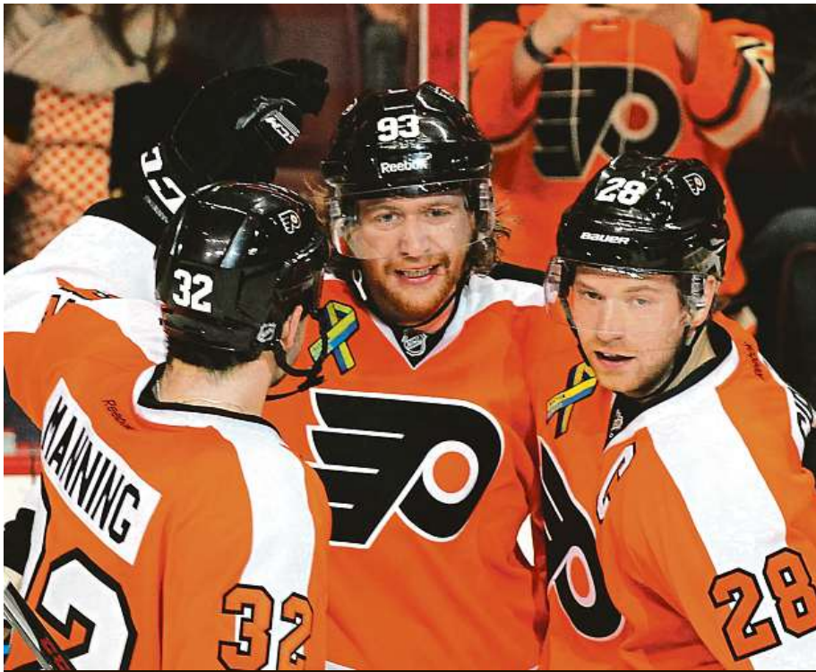
Na trénink Voráčkovy Philadelphie mohou lidé vyrazit den před zápasem s Chicagem. MAJRA

Za oceán ale letos přijedou také další dva týmy. Zatímco Philadelphia Flyers a Chicago Blackhawks odstartují sezonu počátkem října v Praze, Buffalo Sabres a Tampa Bay Lightning proti sobě nastoupí v rámci dvou zápasů ve Stockholmu 8. a 9. listopadu.