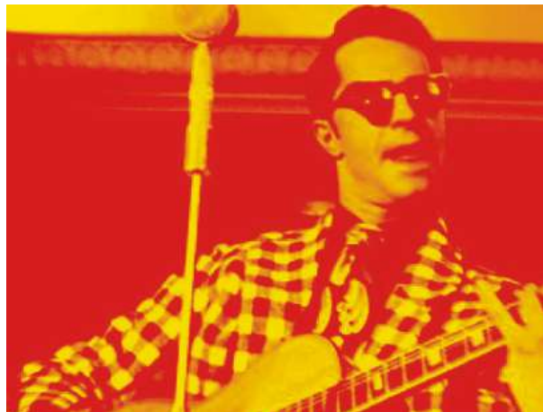
Muzikál Šakalí léta