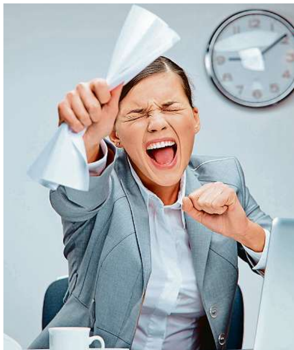
Návrat z dovolené přináší tlak na nervovou soustavu.