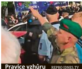
Pravice vzhůru

pouze uklidňoval situaci mezi odpůrci a příznivci SPD. Muži za hajlování přitom hrozilo až tříleté vězení. IDNES.cz