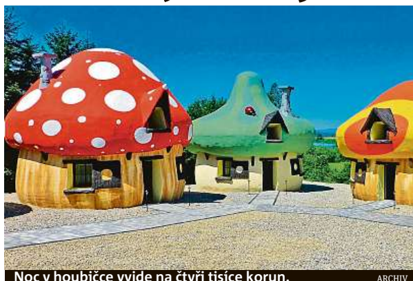
Noc v houbičce vyjde na čtyři tisíce korun.

lisách, případně dobových prostorách. „Po Dětenicích, kde je možné spát v rytířských pokojích, je nyní zájem třeba o středověký kemp v Malešově u Kutné Hory,“ vysvětluje Havlíčková. Češi rádi bydlí o dovolené i v sudech, srubech v korunách stromů nebo v indiánských teepee. Ceny se pohybují od 1500 do 3000 korun. Provozovatelé lákají i na romantiku pro nejmenší. Na Křivoklátsku vyrostla například vesnička s domečky připomínající šmoulí příbytky. PH