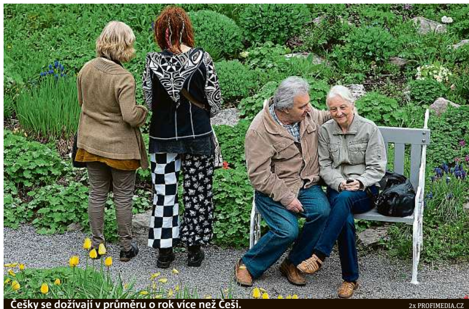
Češky se dožívají v průměru o rok více než Češi.

Češi se mohou pyšnit čtvrtou nejnižší standardizova-