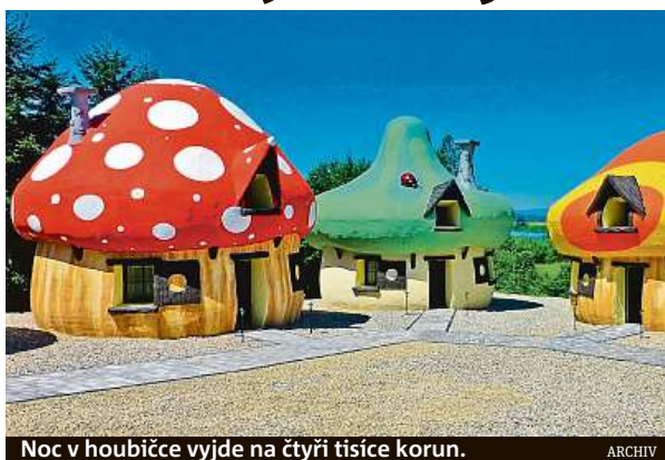
Noc v houbičce vyjde na čtyři tisíce korun.

lisách, případně dobových prostorách. „Po Dětenicích, kde je možné spát v rytířských pokojích, je nyní zájem třeba o středověký kemp v Malešově u Kutné Hory,“ vysvětluje Havlíčková. Češi rádi bydlí o dovolené i v sudech, srubech v korunách stromů nebo v indiánských teepee. Ceny se pohybují od 1500 do 3000 korun. Provozovatelé lákají i na romantiku pro nejmenší. Na Křivoklátsku vyrostla například vesnička s domečky připomínající šmoulí přibytky. PH