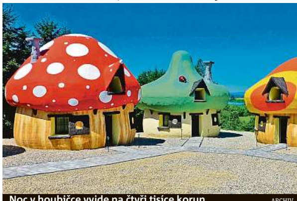
Noc v houbičce vyjde na čtyři tisíce korun.

lisách, případně dobových prostorách. „Po Dětenicích, kde je možné spát v rytířských pokojích, je nyní zájem třeba o středověký kemp v Malešově u Kutné Hory,“ vysvětluje Havlíčková. Češi rádi bydlí o dovolené i v sudech, srubech v korunách stromů nebo v indiánských teepee. Ceny se pohybují od 1500 do 3000 korun. Provozovatelé lákají i na romantiku pro nejmenší. Na Křivoklátsku vyrostla například vesnička s domečky připomínající šmoulí přibytky. PH