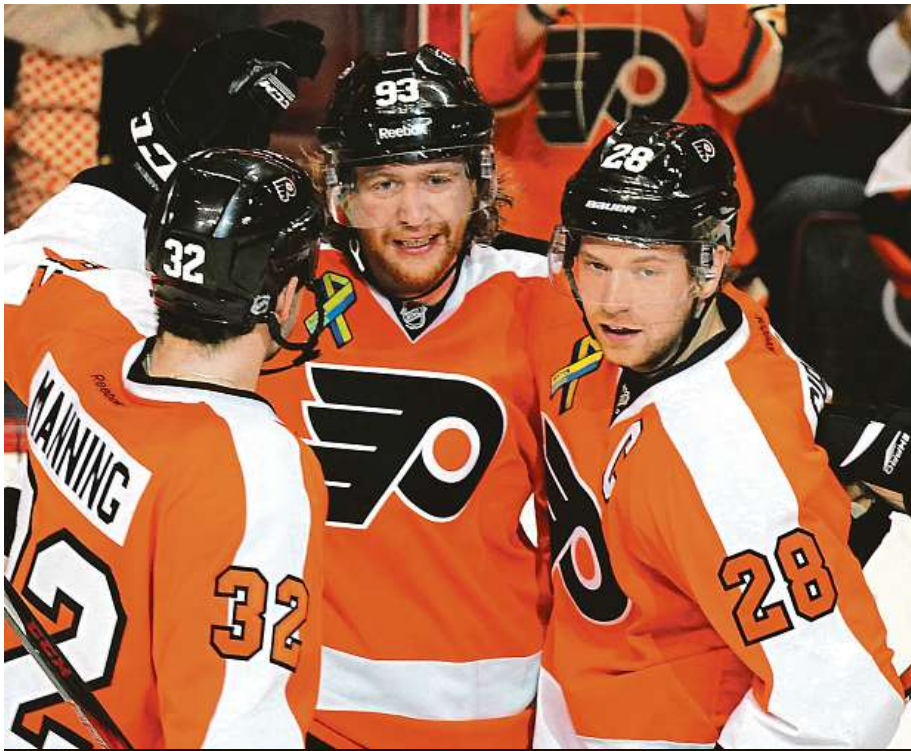
Na trénink Voráčkovy Philadelphie mohou lidé vyrazit den před zápasem s Chicagem. MAJRA

Za oceán ale letos přijedou také další dva týmy. Zatímco Philadelphia Flyers a Chicago Blackhawks odstartují sezonu počátkem října v Praze, Buffalo Sabres a Tampa Bay Lightning proti sobě nastoupí v rámci dvou zápasů ve Stockholmu 8. a 9. listopadu.