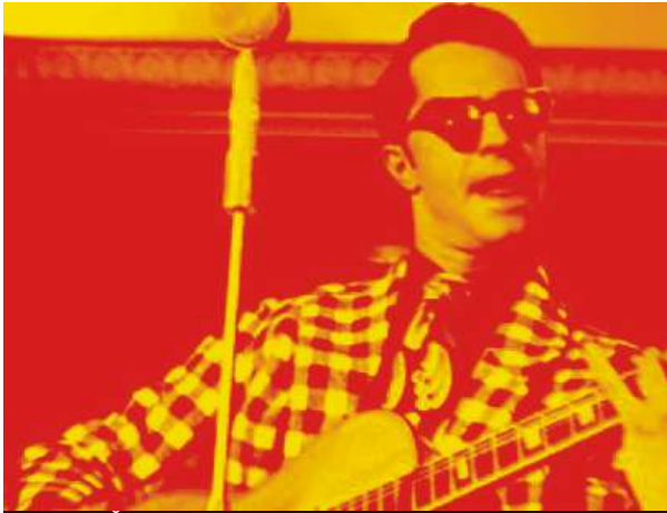
Muzikál Šakalí léta