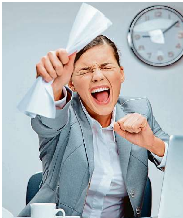
Návrat z dovolené přináší tlak na nervovou soustavu.