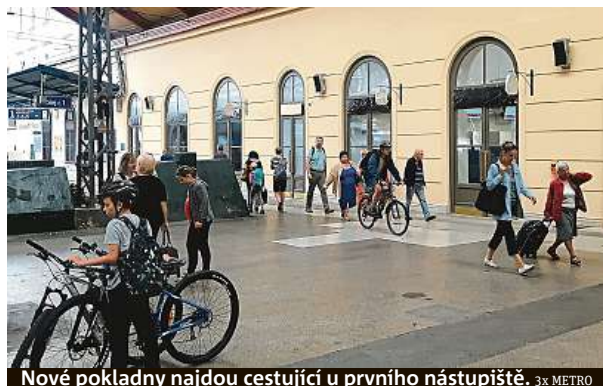
Nové pokladny najdou cestující u prvního nástupiště. 3x METRO