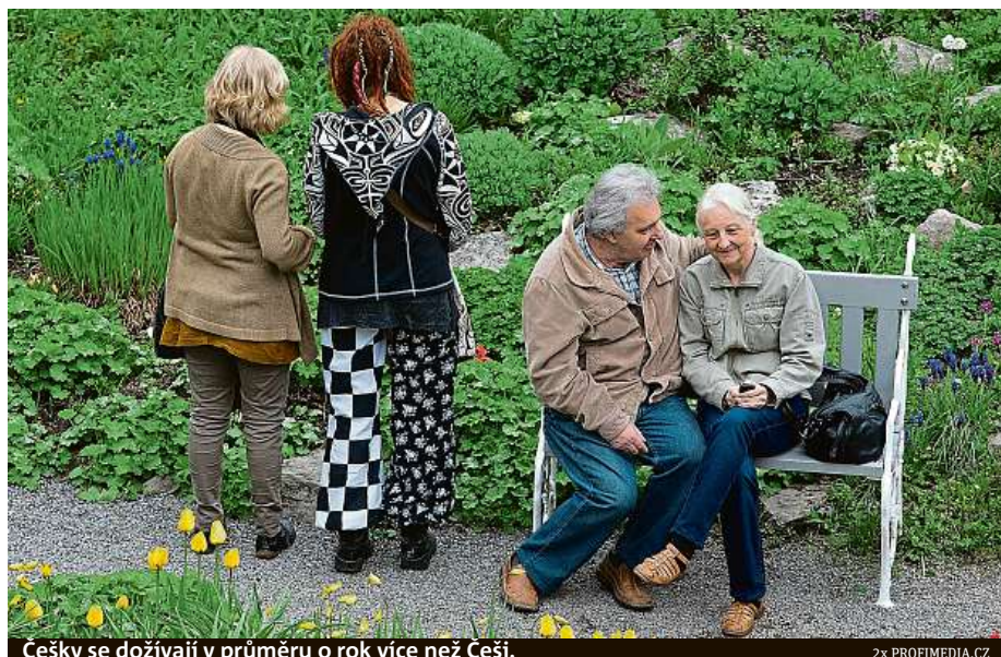
Češky se dožívají v průměru o rok více než Češi.

Češi se mohou pyšnit čtvrtou nejvyšší standardizova-