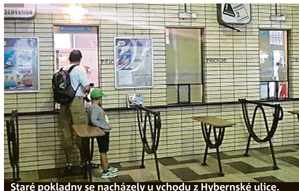
Staré pokladny se nacházely u vchodu z Hyberské ulice.

Masarykovo nádraží v Praze má nové pokladny na místě bývalých záchodků. Ty staré skončí v nejbližších dnech.