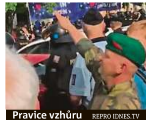
Pravice vzhůru

pouze uklidňoval situaci mezi odpůrci a příznivci SPD. Muži za hajlování přitom hrozilo až tříleté vězení. IDNES.cz