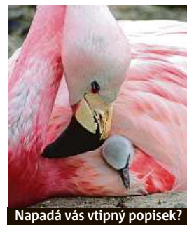
Napadá vás vtipný popisěk?

Napište bublinu a reagujte na sloupek na: www.facebook.com/denikmetro