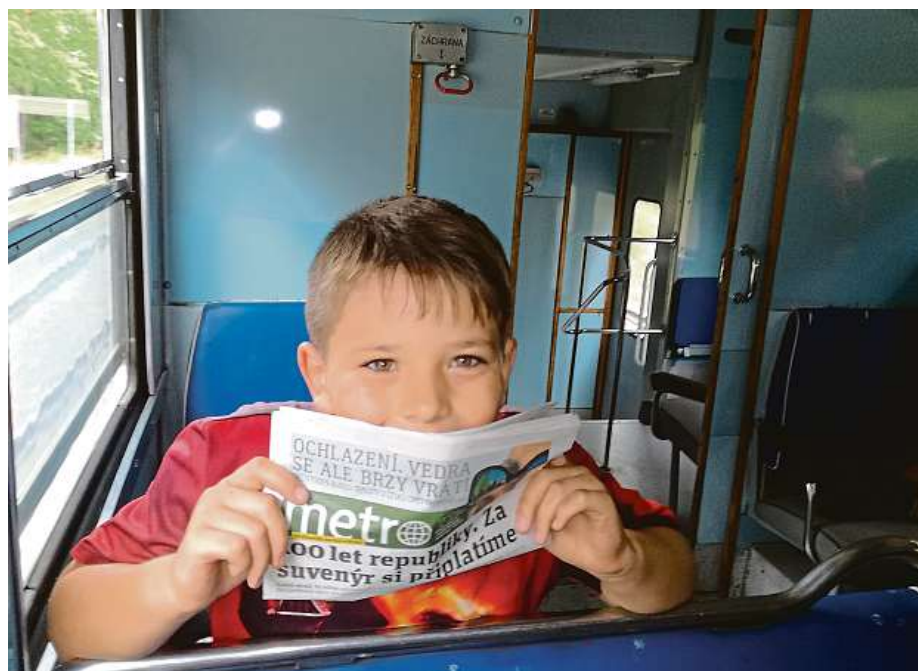
100 let republiky s interiérem žabotlamu.