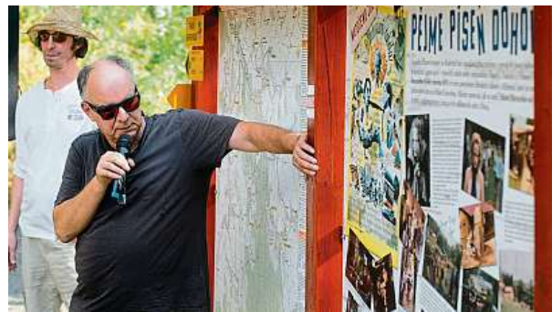
Trojan při slavnostním otevření turistické tabule

z natáčení i z filmu mohou lidé vidět například tehdy čtrnáctiletou Annu Geislerovou, pro niž to byla první filmová role. Režisér Trojan začal film připravovat před pádem komunismu v roce 1989, kdy byl ještě studentem FAMU. Autory scénáře byli Jan Hřebejk a Petr Jarchovský, tehdy rovněž studenti filmové školy. ČTK