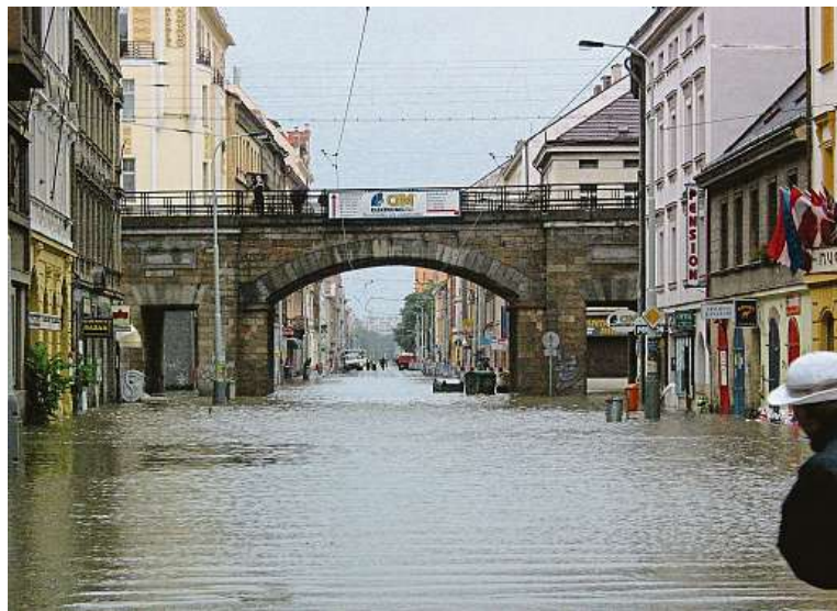
V Praze to vypadalo jako v apokalyptickém filmu. Snímky zachycují Karlín – 13. srpna 2002 a srpen 2018.