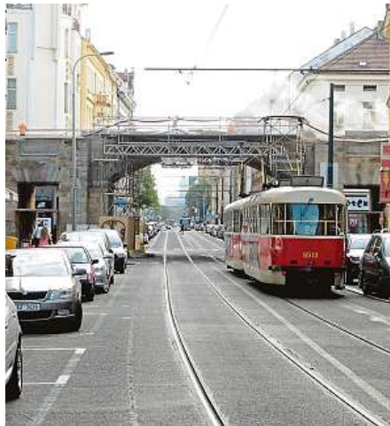
V Praze to vypadalo jako v apokalyptickém filmu. Snímky zachycují Karlín – 13. srpna 2002 a srpen 2018.