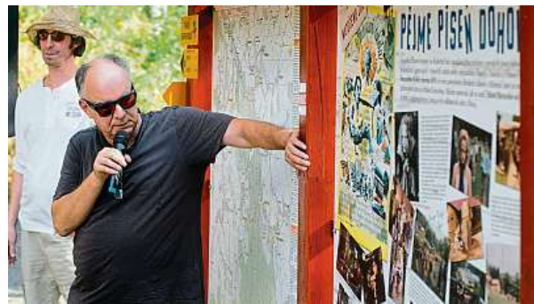
Trojan při slavnostním otevření turistické tabule

z natáčení i z filmu mohou lidé vidět například tehdy čtrnáctiletou Annu Geislerovou, pro niž to byla první filmová role. Režisér Trojan začal film připravovat před pádem komunismu v roce 1989, kdy byl ještě studentem FAMU. Autory scénáře byli Jan Hřebejk a Petr Jarchovský, tehdy rovněž studenti filmové školy.