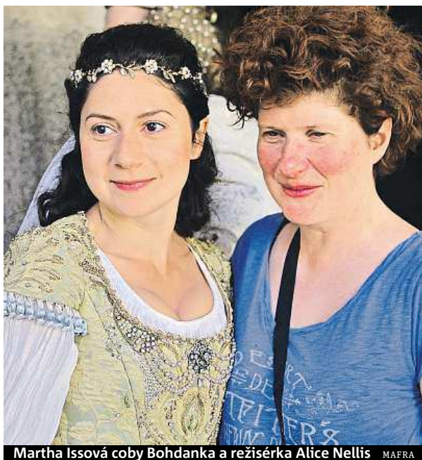
Martha Issová coby Bohdanka a režisérka Alice Nellis

To Alice Nellis psala podle námětu Boženy Němcové scénář Sedmery krkavců deset let. Do hlavní role obsadila Marthu Issovou. Exteriéry na-