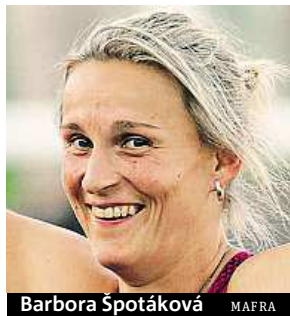
Barbora Špotáková