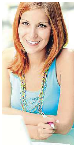
Praxe je nutná.

Nárok na podporu po dobu pěti měsíců máte tehdy, pokud jste vysokoškolák a odpracovali jste brigádně alespoň dva roky. Přihlásit se do evidence však není povinnost, například pokud chce absolvent shánět práci v cizině nebo se dál věnovat studiu na jiné škole.