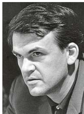
Spisovatel Milan Kundera na snímku z roku 1967

„Světově proslulý a v mnoha ohledech záhadný autor, jehož dílo bylo přeloženo do čtyřicítky jazyků,“ píše Le Figaro. Život romanopisce, který byl nejprve básníkem, byl úzce propojen s dějinami 20. století, dodává deník. Předmluvu k francouzskému