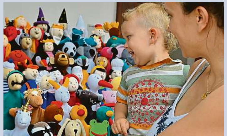
Desítky smějících se dětí se baví na oblíbeném festivalu v Kamenici na Lipou. ČTK

Až do neděle se v zámku v Kamenici nad Lipou koná prázdninové pohodový festival pro celou rodinu Hračkobraní. Jedná se o přehlídku hraček z přírodního materiálu, jejich výrobců či návrhářů, o tvůrčí dílny s možností vyzkoušet si výrobu jednoduchých hraček, bohatý doprovodný program a mnoho dalšího. Podle organizátorů a samotných výrobců hraček je akce dobrou protiváhou obchodního center, která tento sortiment téměř vůbec nenabízejí. ČTK