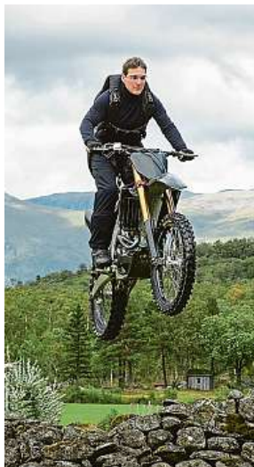
Nepolapitelný Ethan Hunt musí na motorce skočit z útesu.

Úvod do děje sedmičky je pojat poměrně staromilsky. Nejen fanoušci série si při něm připomenou, proč se o Huntovi odjakživa v kuloárech mluvílo jako o americkém Jamesi Bondovi. Spočívá v jakémsi nostalgickém devadesátkově laděném výletu pod ledem pokrytou hladinou moře. Zde se prohání ruská ponorka se záhadnou supertechnologií, kterou řídí umělá inteligence v jakémsi obrovském Fabergého vejci. Jak jistě správně tušíte, právě po stopě tohoto rádoby desátého záporáka z jedniček