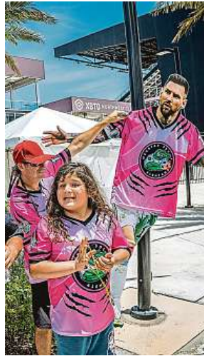
V Miami mají fanoušci zatím jen Messiho figurínu.

„Se svým rozhodnutím jsem spokojený. Jsem připravený a dychtivý postavit se nové výzvě,“ řekl sedminásobný držitel Zlatého míče