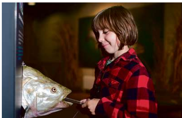
Voda je úžasná, zábavná a dobrodružná.

lidské smysly – vedle zraku zapojíte svůj sluch, hmat i chuť.