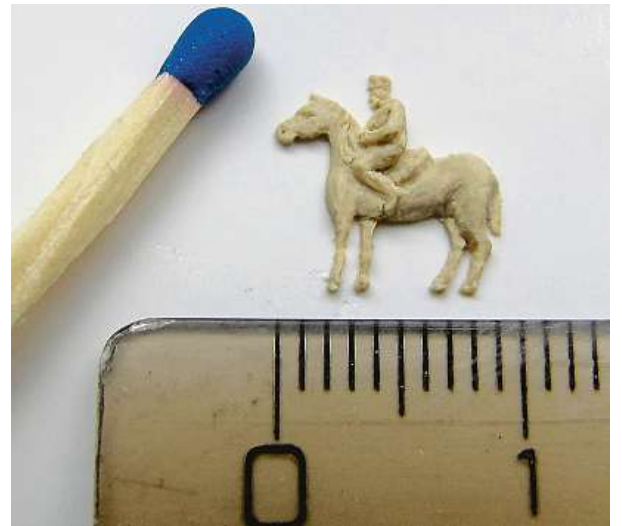
Miniaturní socha propracovaná do nejmenších detailů