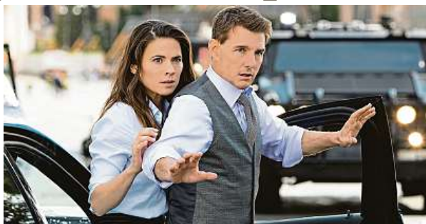
Hayley Atwellová a Tom Cruise mají v novém snímku hned několik společných akčních scén.

Zmiňovaný Top Gun: Maverick, na kterém se mimochodem coby scenárista McQuarrie rovněž podílel,