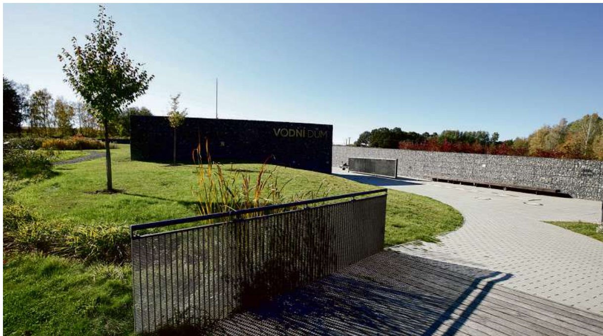
Z dálnice D1 sjeďte na sjezdu Soutice (Exit 56), pak už jsou to k Vodním domu jen čtyři kilometry.

Samotná expozice Vodního domu je navržena tak, aby učila prostřednictvím neobvyklých zážitků a zajímavých pozorování, jejichž iniciátorem je návštěvník. Významnou roli zde hrají všechny