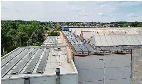
Významný je i ekologický aspekt projektu, díky provozu solární elektrárny totiž dojde také k úspoře emisí CO 2 . PRAŽSKÉ STROJÍRNY

Solárních panelů je 2200, pokrývají plochu 4662 metrů čtverečních a jsou schopny vyrobit až 980 megawatthodin elektřiny ročně, což odpoví